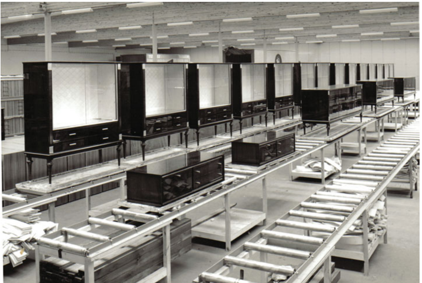
Onder: Bandwerk in een Izegemse meubelfabriek (wellicht Rousseau, begin jaren 1970). Uit: Archief en documentatiecentrum Ten Mandere Izegem (ATM), Fotocollectie, Actualiteiten, AC00492.