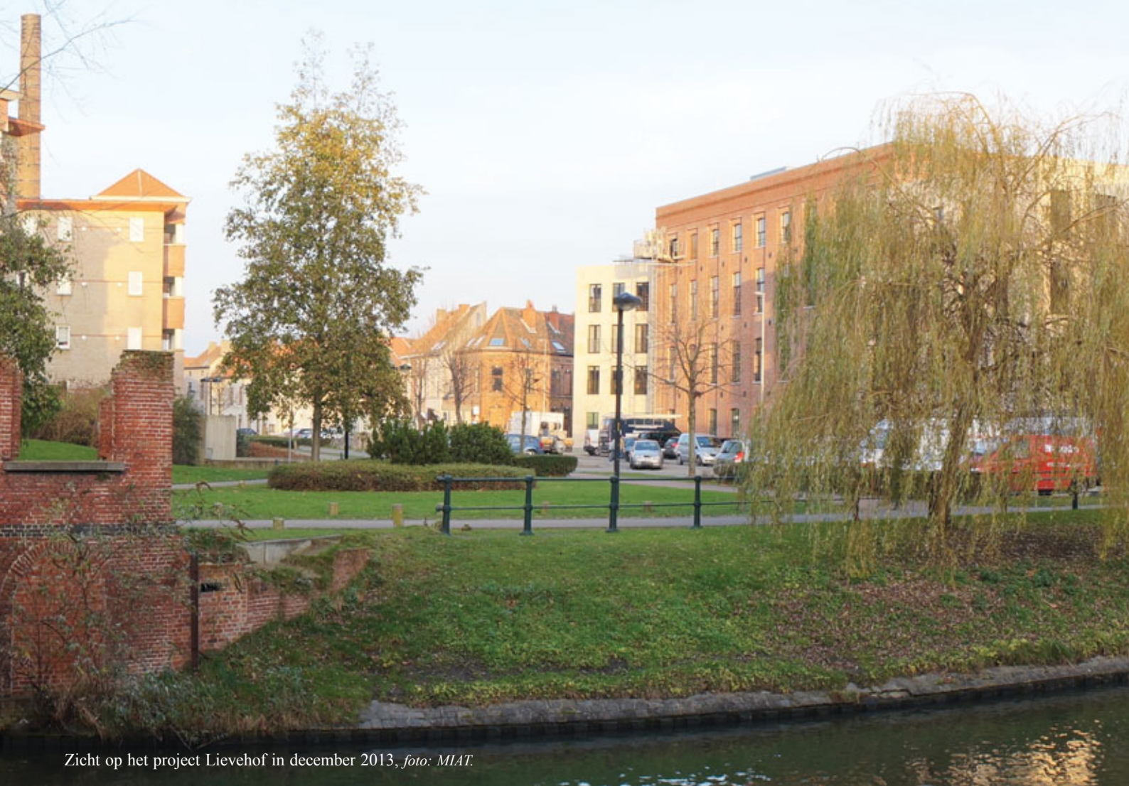
Zicht op het project Lievehof in december 2013, foto: MIAT.