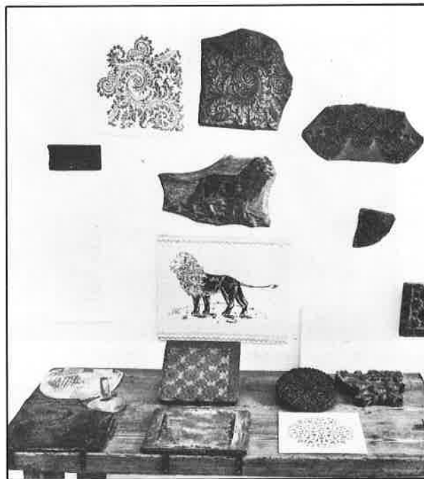
Twents Gelders Textielmuseum Enschede : oude druktafel met antieke drukblokken