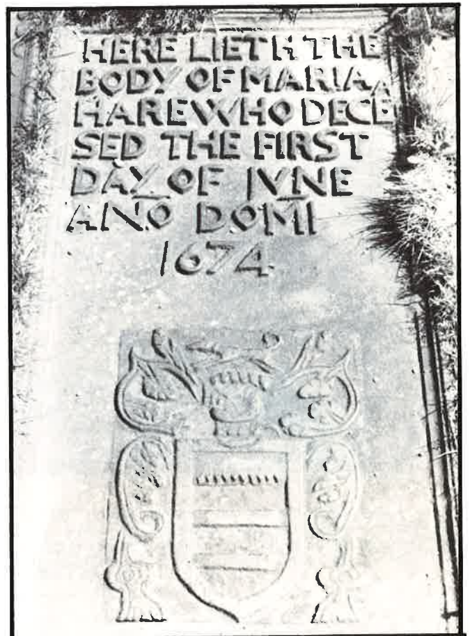
△ Gietijzeren grafstenen uit de 17de eeuw ▷

De hierbij afgebeelde exemplaren, alhoewel reeds daterend van resp. 1619 en 1674, illustreren de duurzaamheid van het gietijzer bij regelmatig onderhoud.