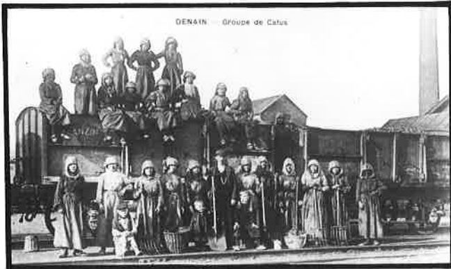
Groepsfoto van vrouwen en kinderen tewerkgesteld in de kolenmijnen van Wallonië, ca. 1900. (Prentkaart)