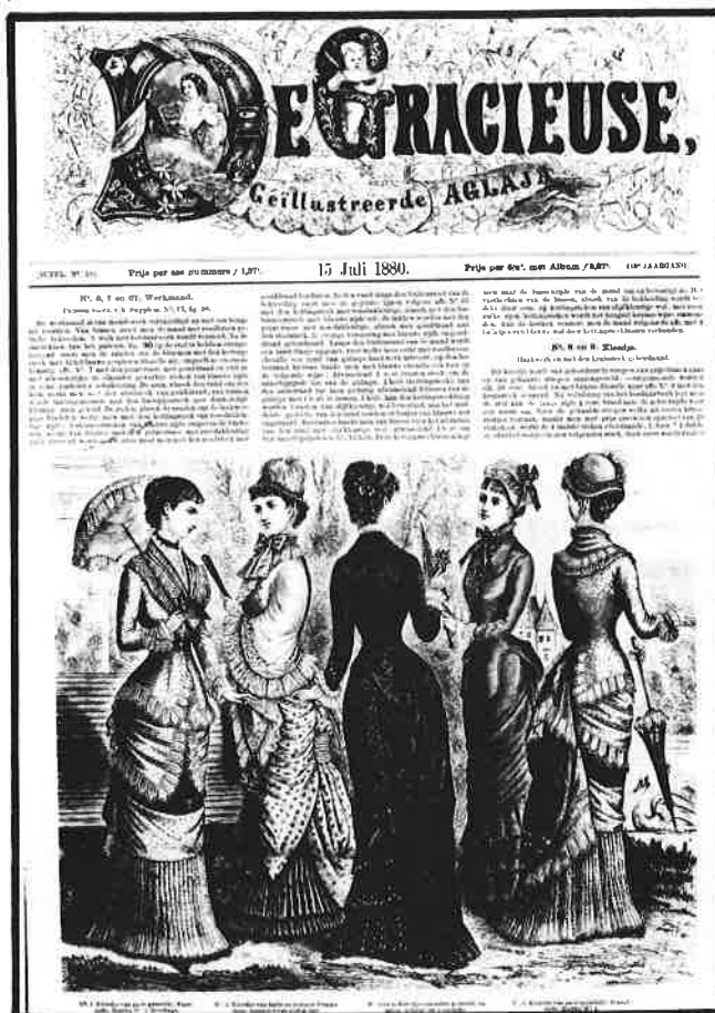
"De Gracieuse - Geïllustreerde Aglaja" (1880) : één der modebladen waarnaar de burgervrouw zich moest voegen : zich correct gedragen en kleden was immers het teken van sociaal succes.

Met het steeds sterker insnoeren van de taille, werd het corset in medische kringen en geschriften verantwoordelijk gesteld voor alle vrouwenziekten van de burgervrouw : tering, flauwvallen, hart-