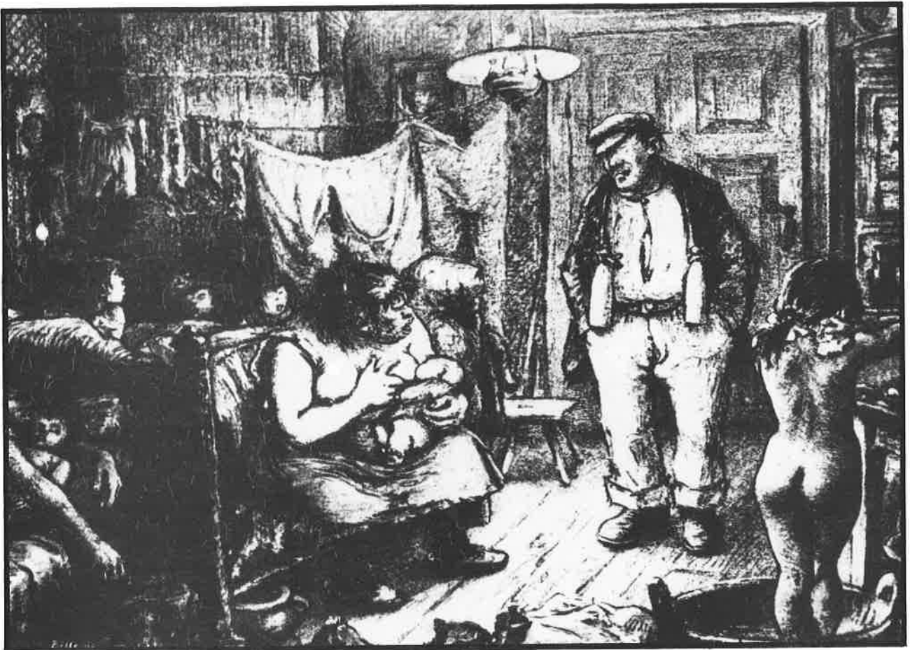
Het schrijnend beeld der ellende van de overbevolking in een arbeiderswoning. (Heliogravure van Heinrich Zille, Berlijn 1902)