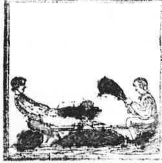
Door ijzeren kamren heen gerukt, Wordt hier de zaakloop afgeplukt.