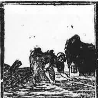
Het natte vlas wordt met beleid, Tot drooging op het gras gespreid