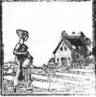
Gieten, loogen en ook weeken, Is de kunst om wit te bleeken.