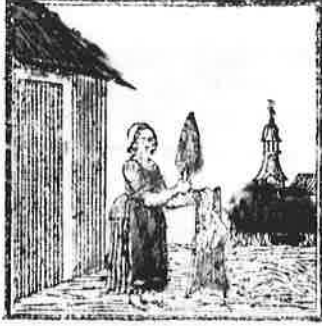
Met kloppen, als klikklakgeluid, Krijgt deze vrouw het vuil er uit.