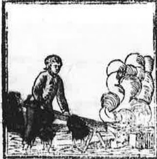
't Heete vlas met volle grepen, Wordt den flengel uitgenepen.