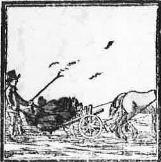
De ploeg die door den akker snijdt, Maakt losse grond en vruchtbaarheid.