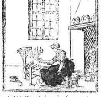
Goed gehield, geloof mij vrij, Dan wordt het lijn en zacht als zij.