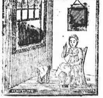
De naafler maakt, of gij het weer, Het lijnwaad tot gebruik gereed.