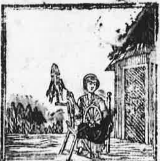
't Zachte vlas, zoo goed gewonnen, Wordt nu tot een draad gesponnen.