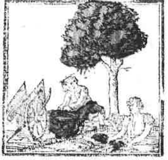
Daar 't vles zich van den flengel scheidt, Laat men het rotten met beleid.