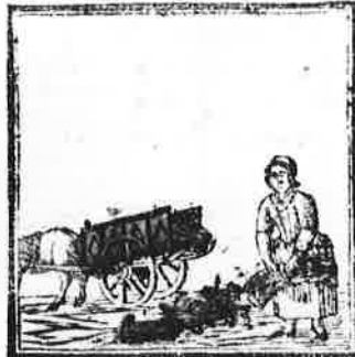
Tot bosjes ziet gij, liefste kind! Het deze vrouw hier zamen bindt.