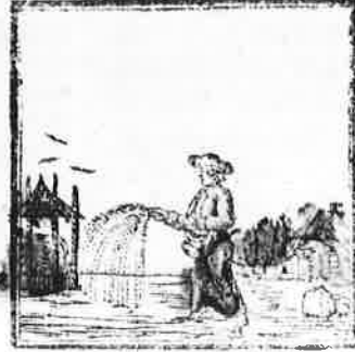
Het lijn of vlaszaad, ziet gij? wordt Op dezen akker verschoort.