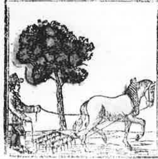
Door eigen werkt hier deze man Het zaai er in, dat 't groeijen kan.