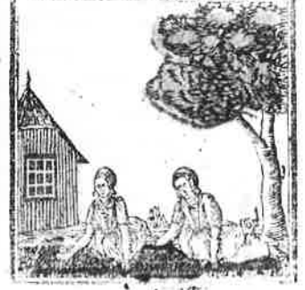
Geveelt wordt ook het jonge vlas Op zinen tijd en juist van pas.