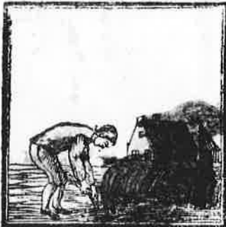
Daar deze man het rijp bevond, Trekt hij het lustig uit den grond.