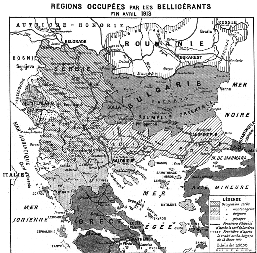
Kaart 1: Veroverd gebied na de Eerste Balkanoorlog.