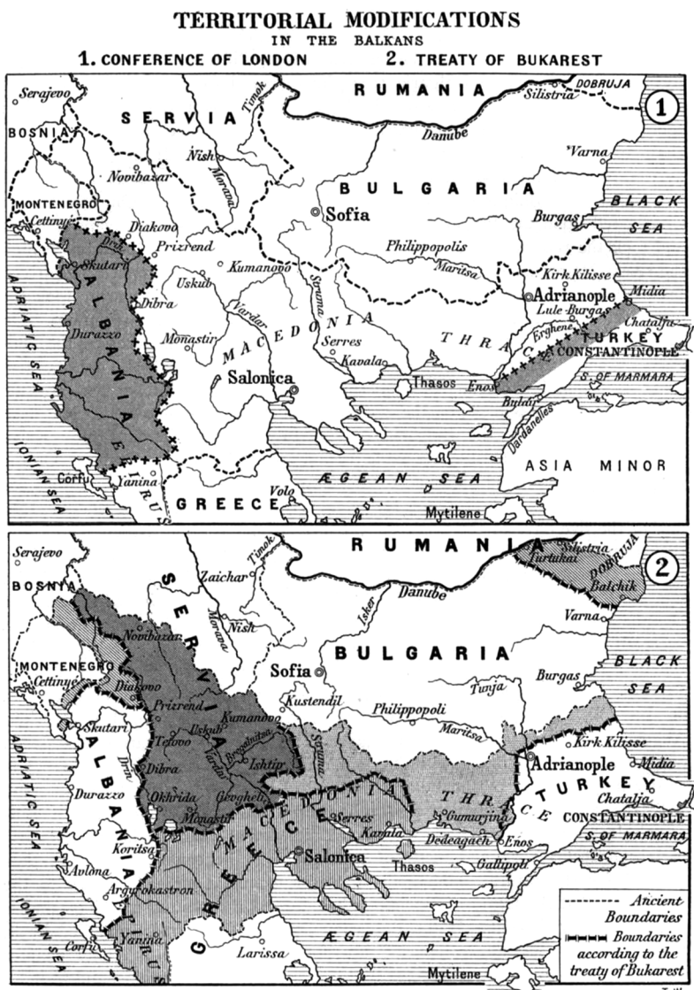
Kaart 2: Grenzen voorgesteld door de Conferentie van Londen (30 mei 1913) en vastgelegd door het verdrag van Boekarest (10 augustus 1913).

krijgt en Griekenland 51 procent. 58 Zo is de proportie van het grondgebied dat Serviërs en Bulgaren onder elkaar verdelen zonder twijfel omgekeerd evenredig met de nationale voorkeur van de betrokken bevolking (zie kaart 2).