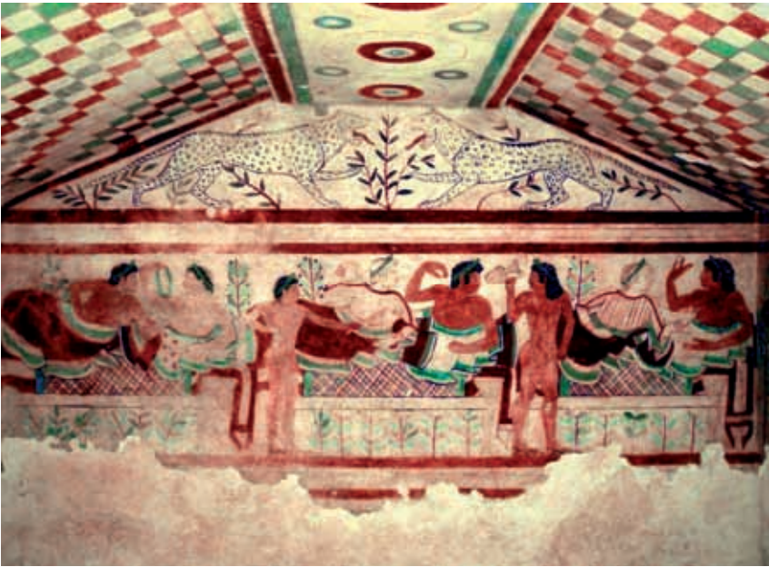
Afb. 2. een afbeelding van een gemengd, aanliggend Etruskisch begrafenisbanket in de Tombe van de Luipaarden in Tarquinia

westerse elites introduceerden. 16 Hoewel ze de Fenicische invloeden in Italië niet onbesproken laat en uitdrukkelijk opmerkt dat de praktijk van het aanliggen al in de achtste eeuw bij de Feniciërs bestond, blijft haar besluit dat het symposion onder Korinthische of Ionische invloed in Centraal-Italië werd geïntroduceerd. De welbekende Murlofriezen uit circa 575 (zie ook infra ) noemt ze als de eerste voorstellingen van het symposion in Italië. Verrassend genoeg beschouwt ze net het zittende banket als een bewijs van het aannemen van een ‘oriëntaliserende’ levenswijze, en het aanliggende symposion als een overname vanuit de Griekse cultuur. 17