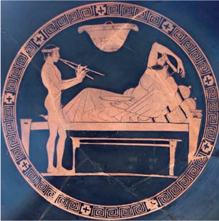
Afb. 1. een afbeelding van een symposion-scène op een Attische roodfigurige drinkbeker (Louvre, Euaion Painter, 460-450 BC)