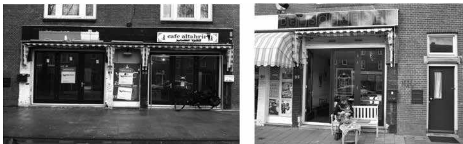
Figuur 2. Commerciële transformatie in de Van der Pekstraat

Deze voorbeelden laten zien hoe culturele initiatieven en voorzieningen gericht op de middenklasse ingezet worden om de buurt te veranderen. We spreken daarbij van kwartiermaken, omdat die initiatieven niet simpelweg het gevolg zijn van een veranderde vraag, maar juist tot doel hebben die vraag te creëren. Daarbij wordt gebruikgemaakt van een discours waarbij de buurt voorgesteld wordt als ‘onontgonnen’ gebied dat in afwachting is van de komst van de middenklasse en hun specifieke consumptiepatronen. Over het algemeen is daarbij geen sprake van kwade bedoelingen bij de ondernemers, kunstenaars of nieuwe bewoners. Sociale en etnische diversiteit wordt gewaardeerd en sommige middenklasse-nieuwkomers maken zich zorgen over te ver doorgevoerde gentrificatie (cf. Tissot, 2014). Desalniettemin zijn ze dominant aanwezig op buurtactiviteiten en dragen ze een beeld uit van wat de buurt en Amsterdam Noord in bredere zin zouden moeten zijn dat nauw aansluit bij de visie van lokale bestuurders.