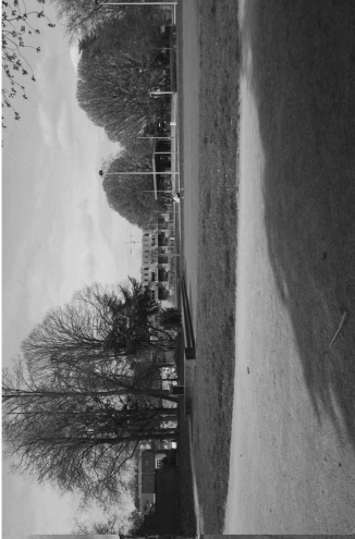
Visueel – groen en parken