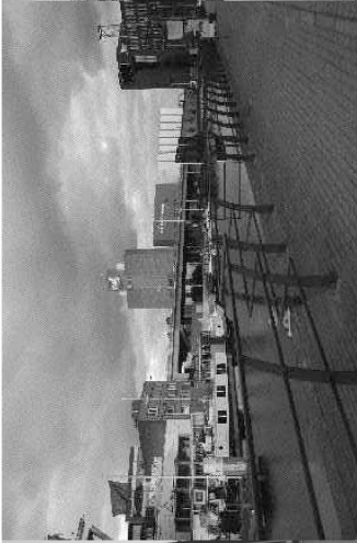
Olfactorisch – mout

"En als je dat vergelijkt met bijvoorbeeld dit afschuwelijk gebouw, dat rood, ja, het is ook de vorm eh. (...) Ja, ongetoeflijk conformistisch. Doe allemaal maar zoals de rest. Dat super strakke design dat weer terug komt. Dit is zielloos." (Tom, 32 jaar)