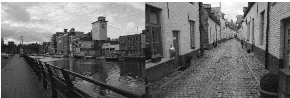
Figuur 1. Overzicht van de buurten die deel uitmaakten van de wandelroute

In de 13 de eeuw woonden hier de vrouwen die dienst deden in de abdij (Stad Leuven, 2013). Momenteel zijn een deel van de huisjes eigendom van particulieren en een deel van het OCMW.