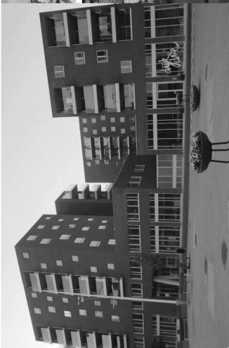
Visueel – gebouwen