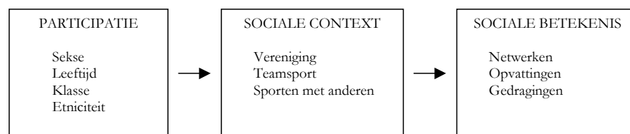
Figuur 1. Geleding van vragen over sport en sociaal kapitaal naar drie deelaspecten (naar Breedveld, 2003: 254)

In deze studie zullen we gebruik maken van het onderzoeksmodel van Breedveld en Van der Meulen (2002/2003). Op basis van dit model leggen we de volgende drie onderzoeksvragen voor: