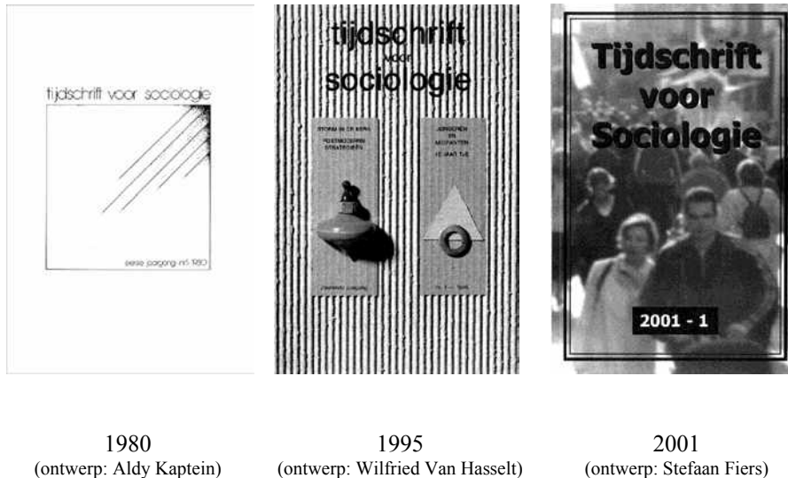
Figuur 1. De omslagen van het Tijdschrift voor Sociologie