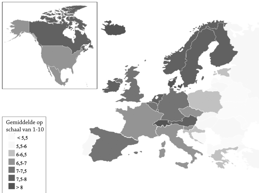
Figuur 2 Gemiddelde beoordeling van geluk. Per land, op schaal van 1 tot 10.