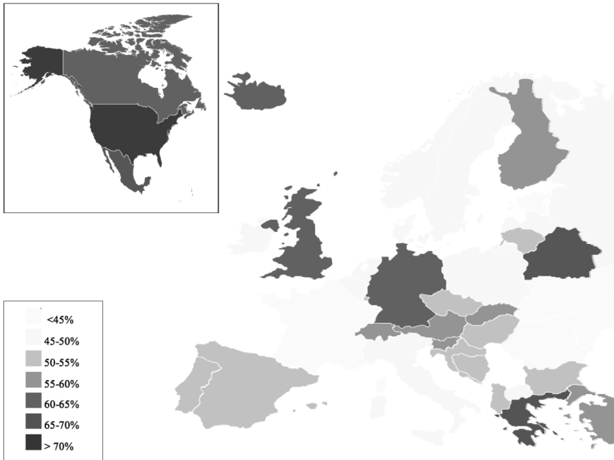
Figuur 3 Percentage van de bevolking met overgewicht.