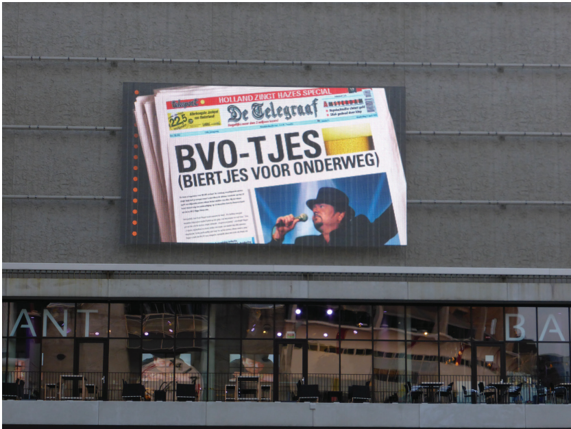
Afbeelding 10 BVO-TJES: digitale gelegenheidskrant boven de entree van de Ziggo Dome in Amsterdam Zuidoost voor aanvang van Holland zingt Hazes (28 maart 2014)

flesjes Heineken of glazen bier neergezet, vaak met de tekst BVO-tje : Biertje Voor Onderweg, een uitdrukking van Hazes die dankzij Zij gelooft in mij , de documentaire die John Appel in 1999 over Hazes maakte, een staande Nederlandse uitdrukking is geworden. Tijdens de twee minuten stilte steken de Hazesfans, met een biertje in de hand, ter nagedachtenis een sigaret op.