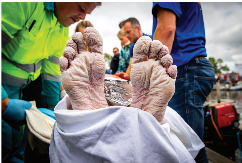
Afbeelding 7 De voeten van Maarten van der Weijden na 55 uur zwemmen (20 augustus 2018)