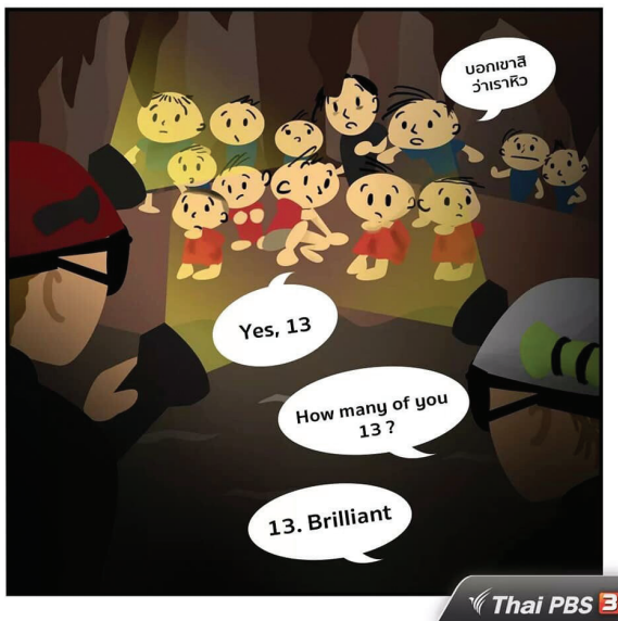
Afbeelding 2 Het moment suprême, de jongens in de grot gevonden, in de strip De Dertien. Afbeelding verspreid via Thaise sociale media (juli 2018)

gedragen. In diezelfde week begon een team van Noord-Thaise kunstenaars aan een schilderij van dertien meter breed om de grot, de gebeurtenissen en zijn helden in realistische stijl vast te leggen. Center piece is het portret van de overleden Thaise marinier, voor wie er tegelijkertijd ook meerdere standbeelden werden geïnitieerd.