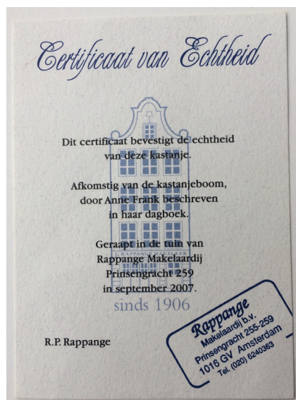
Afbeelding 16a/b Relatiegeschenk Makelaar Rappange met certificaat van echtheid uit 2007