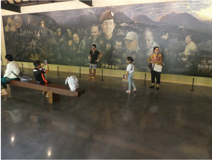
Afbeelding 3 Bezoekers poseren voor het schilderij van de reddingsoperatie in de bij de grot gebouwde tentoonstellingsruimte, geschenk van kunstenaar Chalermchai Kositpipat (Mae Sai District, 8 mei 2019)