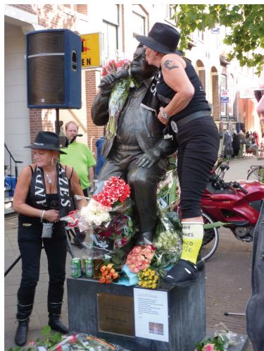
Afbeelding na/b Een gipsen BVO-tje en veel bier bij de Hazesherdenking van 23 september 2009

Deze casus toont aan hoe de herdenkingsrituelen rond Hazes teruggrijpen op allerlei elementen die kenmerkend zijn voor herdenkingsrituelen in het algemeen: een vast tijdstip, een vaste plek gemarkeerd door een standbeeld of monument, bloemen en stiltes. Ook zulke elementen zijn echter niet vaststaand of tijdloos. Zoals Rob van Ginkel in zijn studie naar de herdenkingscultuur rondom de Tweede Wereldoorlog heeft laten zien is het model voor de dodenherdenking, waaronder de inmiddels vanzelfsprekende twee minuten stilte, op vrij willekeurige wijze tot stand gekomen en door een eenling bedacht (2011: 177-186). Tegelijkertijd onderscheiden de Hazesrituelen zich door het incorporeren van een aantal, tot dan toe niet met herdenkingsritueel verbonden elementen, waardoor er nieuwe combinaties, en daarmee zelfs nieuwe vormen van ritueel konden ontstaan, zoals het afscheid in de Arena.