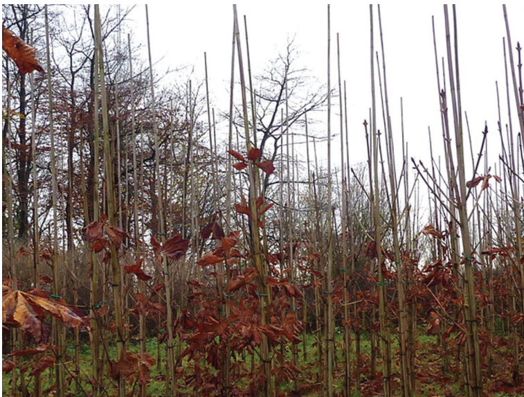
Afbeelding 18 Het Anne Frankbomenbosje in het Amsterdamse Bos in 2012