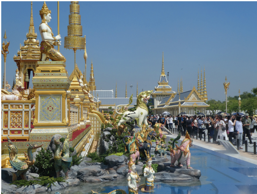
Afbeelding 14 Gedeelte van het tijdelijk koninklijk crematorium, na de crematie als 'erfgoed' te bezichtigen voor het algemene publiek (Bangkok, 2 november 2017)

handgeweven dertien meter lange zijden gordijnen enzovoort, enzovoort. Een voortdurende nadruk op de oudheid en onveranderlijkheid van deze rituelen, en op de Thaise uniciteit en Thaise eigenheid van al deze traditionele kunsten en ambachten, geeft dit erfgoedraamwerk een belangrijke nationalistische component. De nationalistische sentimenten die tot uitdrukking komen in dit erfgoedperspectief moeten geplaast worden in het kader van de algemene nationalistische politiek, die geen enkele ruimte laat voor afwijkende opvattingen of kritiek, en zeker niet waar het gaat om de verering van de monarchie.