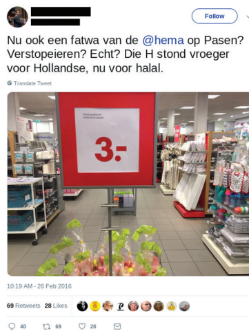
Afbeelding 21a/b HEMA paasfolder en verontwaardigde tweet (voorjaar 2016)