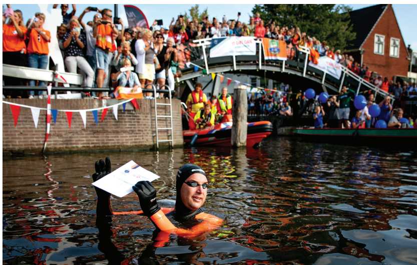
Afbeelding 6 Maarten van der Weijden met stempelkaart bij Sneek (20 augustus 2018)