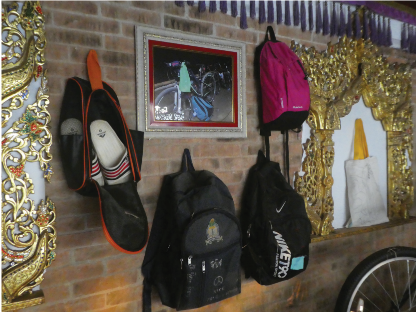
Afbeelding 5 Rugzakken, slippers en een fiets zoals deze door de 'grottenjongens' bij de ingang van de grot waren achtergelaten (zie de foto) in het museum van de nabijgelegen Doi Wao tempel. Na hun redding werden de jongens hier tijdelijk monnik

De casus van 'de grottenjongens' brengt drie thema's bijeen die tezamen het onderwerp van deze oratie zullen vormen: ten eerste, het verschijnsel dat ik high density events noem, gebeurtenissen van 'hoge dichtheid'; ten tweede, popularisering van cultuur; en ten derde, het maken van erfgoed.