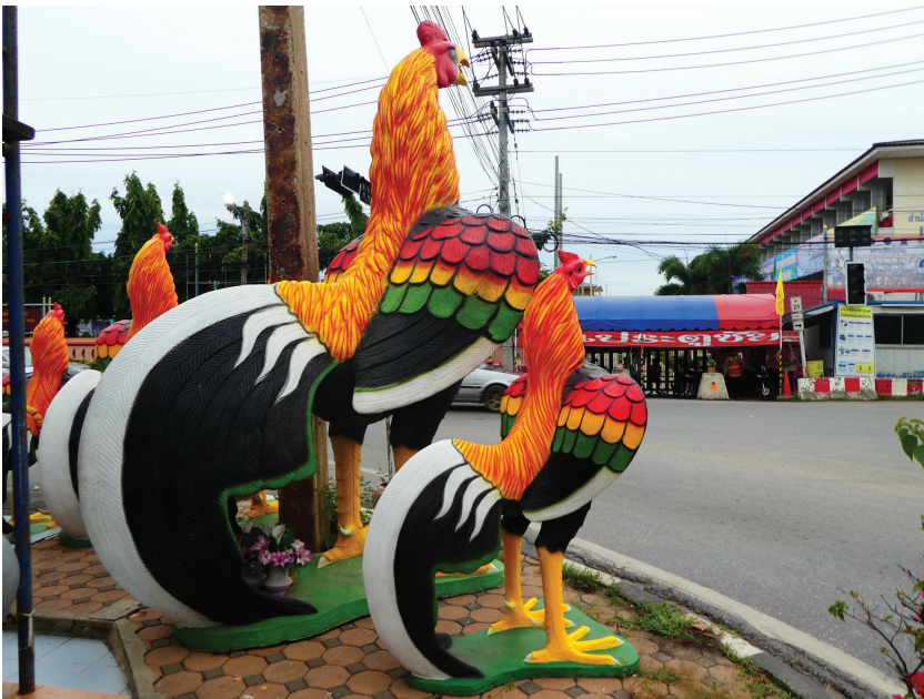
Afbeelding 13 Reuzenhanen (meer dan twee meter hoog) wachtend op een koper bij een winkel in religieuze voorwerpen in Ayutthaya