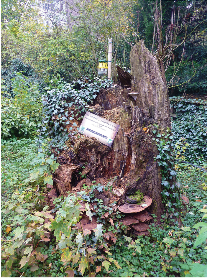
Afbeelding 15 De stromk van de Anne Frankboom met platte tonderzwam (16 november 2012)

genetisch identiek exemplaar (in de context van de Holocaust geen neutrale motivatie), de oorspronkelijke boom moeten vervangen. Verder werden er driehonderd kastanjes opgekweekt: één boom voor elk van de 263 Anne Frankscholen in Europa. Besloten werd om de Anne Frankboom in november 2007 te kappen, en aansluitend de geënte boom ceremonieel te planten. Het kappen ging echter niet door vanwege de vele verontwaardigde en geëmotioneerde reacties die dit besluit opriep, in Nederland en wereldwijd. De strijd om de boom ontwikkelde zich tot een high density event , met een eigen gepopulariseerde cultuur – met de boom als middelpunt – in kinderboeken, strips, cartoons, computerspelletjes, schilderijen,