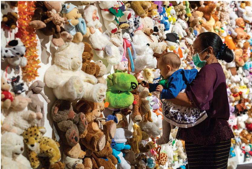
Afbeelding 20 Knuffelmuur herdenking MH17-ramp 2015

Hilversum en belast met het herdenkingsmateriaal van de MH17-ramp (2014), te vragen een 'nationaal knuffelprotocol' te ontwikkelen. Omdat herdenkingsmateriaal zijn vernietiging in de weg staat – al gaat het bijvoorbeeld om natgeregende knuffels – kan het gedeelte waarvan besloten is het niet te bewaren doorgaans niet zonder meer bij het vuilnis worden gezet. Het moet, aldus mijn argument, eerst via geritualiseerde handelingen van zijn sacrale of erfgoedwaarde worden ontdaan. De MH17-knuffels volgden hiertoe de volgende route: als onderdeel van de herdenking in 2015 werden de knuffels verwerkt in een knuffelmuur, en vervolgens werden ze, gedesinfecteerd en schoongemaakt, aan de stichting Geef een knuffel gegeven, een stichting die knuffels uitdeelt aan zieke kinderen. De stichting garandeert dat de kinderen nooit te weten zullen komen waar hun knuffel vandaan komt: ze zijn ontdaan van hun erfgoedkarakter. Dit laat zien hoe, net als het Anne Frankboom materiaal in rituele, charitatieve settings vermeerderd kon worden, geritualiseerd handelen ook onderdeel is van het verminderen van erfgoedmateriaal. In die context valt de moeite die wordt genomen om verlepte bloemen apart te composteren, en nog frisse bloemen naar verzorgingshuizen te brengen – zoals dat bijvoorbeeld met de ruim tienduizend ton bloemen voor Prinses Diana gebeurde – beter te begrijpen.