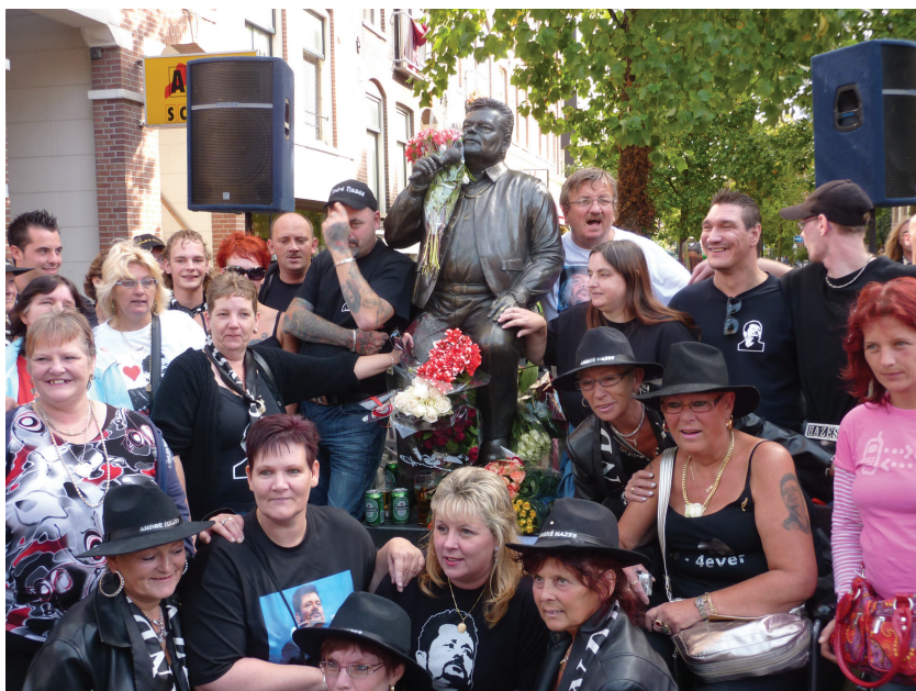
Afbeelding 9 Hazesfans bij het beeld van André Hazes op de Amsterdamse Albert Cuyp markt (herdenking 23 september 2009)

Nabootsing en lichamelijke identificatie vormen de belangrijkste technieken waarmee de Hazesfans invulling geven aan hun behoefte om Hazes te laten voortleven. Gekleed in Hazes-outfit (gleufhoedje, zonnebril, zwarte kleding) ritualiseren de fans Hazes' voorliefde voor bier en sigaretten en zingen zij zijn liederen. Naast bloemen worden bij het standbeeld blikjes en