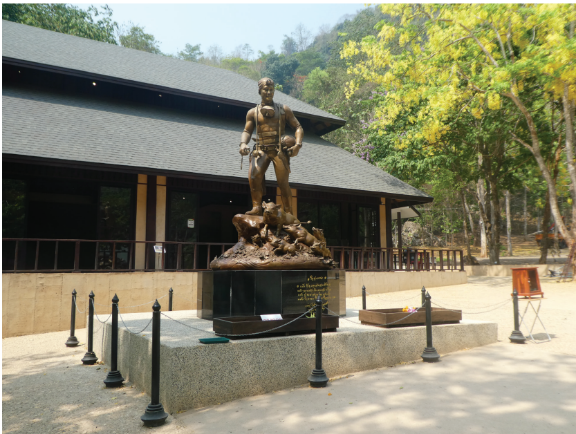
Afbeelding 4 Standbeeld van de omgekomen marinier Sanam Gunar (kunstenaar Chalermchai Kositpipat). Op de achtergrond de tentoonstellingsruimte