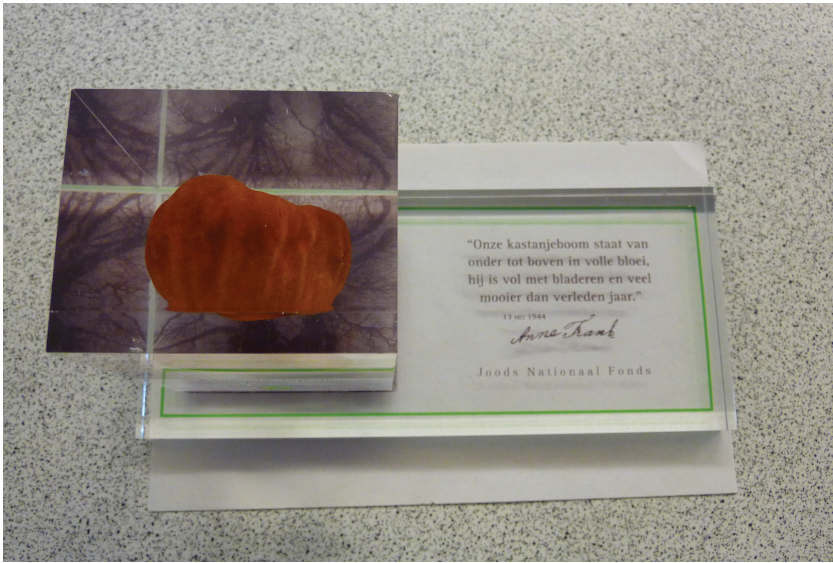
Afbeelding 17 Anne Frankboomkastanje nr. 49 van het Joods Nationaal Fonds in de collectie van het Rijksmuseum (object NG-2010-140-1, copyright publiek domein)