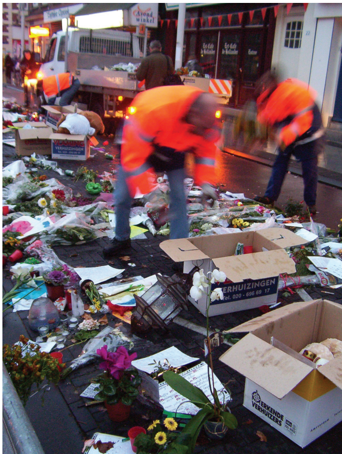
Afbeelding 19 Medewerkers van de Stadsreiniging Amsterdam sorteren materiaal van het tijdelijk monument voor Theo van Gogh (10 november 2004)

en behoud worden te kostbaar. Dit zorgt ervoor dat belangrijke spelers in het maken van deze recente vormen van erfgoed – archieven, musea en onderzoeksinstituten, zoals het Meertens Instituut – niet alleen verplicht zijn om hun selecties te motiveren, maar ook dat zij de verantwoording hebben om zich op gepaste wijze te ontdoen van dat deel van het materiaal waarvoor de keuze op ‘niet bewaren’ is gevallen.