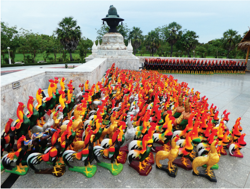
Afbeelding 12 Hanenleger voor de Siamese koning Naresuan (1555-1605) bij een van zijn standbeelden in de Thaise stad Ayutthaya