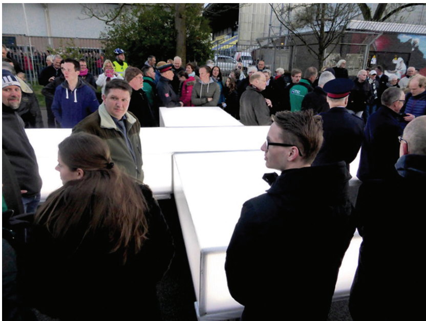
Afbeelding 22 Dragers van het lichtgevend kruis van The Passion vlak voor het moment van vertrek op Witte Donderdag (Leeuwarden, 13 april 2017)

erfgoed verschijnt. Ideeën over de oorzaak van deze dreiging verschuiven van ontkerkelijking naar de aanwezigheid van Nederlandse moslims. Dit laat zien dat, zoals eerder betoogd, weliswaar elk voorwerp of handeling tot erfgoed gemaakt kan worden, maar dat de analyse dit maken in een bredere maatschappelijke of politieke context dient te plaatsen.