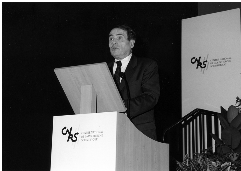
Figuur 3 Bourdieu tijdens het uitspreken van zijn rede

soonlijke en collectieve zelfbeschikking – waarmee de traditioneel door de filosofie nagestreefde activiteit concreet werd gerealiseerd. 17