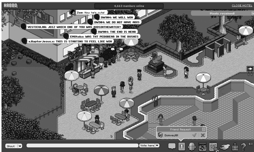
Figuur 1 Screenshot van het begin van de Habbo Raid 2006 2

De non-identiteit Anonymous wordt traditioneel gebruikt door verliefden op Valentijnsdag of door boze brieven-schrijvers, maar de stormloop op Habbo markeert het begin van Anonymous als een grillige en vaak meedogenloze virtuele beweging. Anonymous' bekendste actie was het tijdelijk uitschakelen van de websites van financiële instellingen (zoals Mastercard, VISA en Paypal) die in december 2010 Wikileaks hun diensten ontzegden, maar de beweging heeft in de afgelopen jaren een duizelingwekkend aantal uiteenlopende acties uitgevoerd.