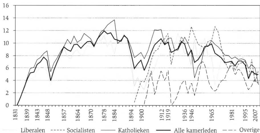
GRAFIEK 1. De gemiddelde ervaring in de Kamer (in jaren) na verkiezingen, 1831 tot 2007. 1

Tot het einde van de negentiende eeuw vertoont de grafiek een relatief eenduidig patroon: het algemene gemiddelde groeit stelselmatig aan, tot meer dan tien jaar. Na 1882 piekt het gemiddelde onder de katholieke kamerleden op bijna 14 jaar. Enkel de verkiezingen van 1848 markeren een scherpe tijdelijke daling. Het algemeen patroon van de eerste zestig jaar parlementaire geschiedenis is er dus een van langer wordende en stabiele carrières. Hibbings kritiek op Polsby in gedachten, hoeft dit niets te zeggen over de institutionalisering van de Kamer van volksvertegenwoordigers, maar er vormt zich in deze periode duidelijk een parlementaire elite.