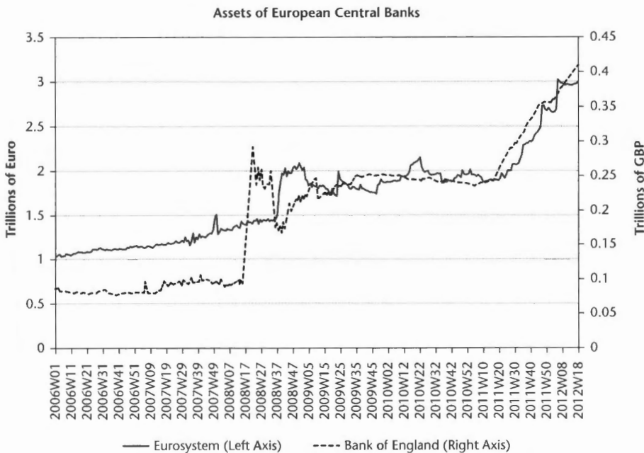
FIGUUR 1. De jaarbalans van de Centrale Bank voor en na de crisis (bron: Bank of England; ECB).

banken overeind te houden, transfereerden overheden van geavanceerde economieën triljoenen euro's van private schulden naar de publieke betalingsbalans (zie figuur 1), terwijl de langdurige recessie belastinginkomsten liet slinken en de uitgaven voor de verzorgingsstaat door de oplopende werkloosheid verder stegen. De recessie en de verslechterde vastgoedmarkt (gerelateerd aan een bubbel of niet) hebben de situatie voor de banken beslist verergerd, zelfs in landen die in het begin niet geraakt werden door de crisis. Uiteindelijk lijkt een degelijk begrotingsbeleid van nationale overheden intuïtief de juiste keuze. Goed of slecht begrotingsbeleid verklaart echter niet duidelijk of een land al dan niet hard geraakt wordt door de crisis.