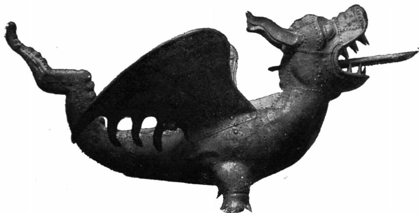
De Draak van het Belfort.