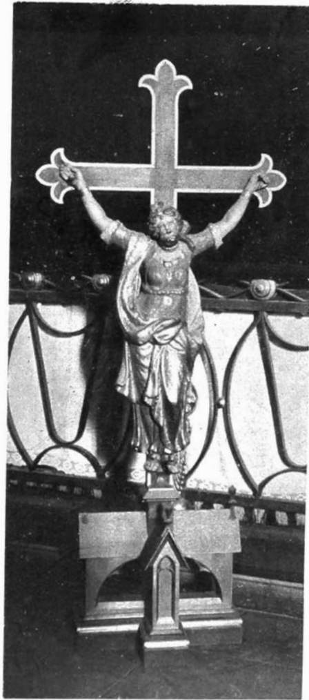
Oud beeld in de parochiekerk van Velsike-Ruddershove.