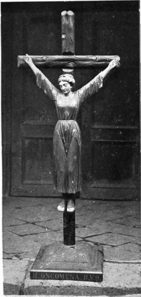
Oud beeld in de kerk van Bavegem.