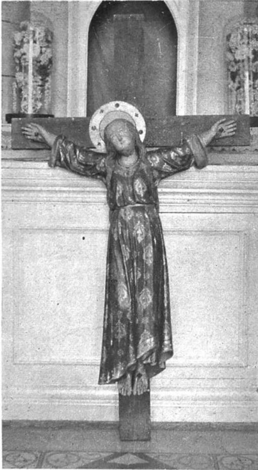
Oud beeld in de « Sinte Oncommena Kapel » te Velsike-Ruddershove.