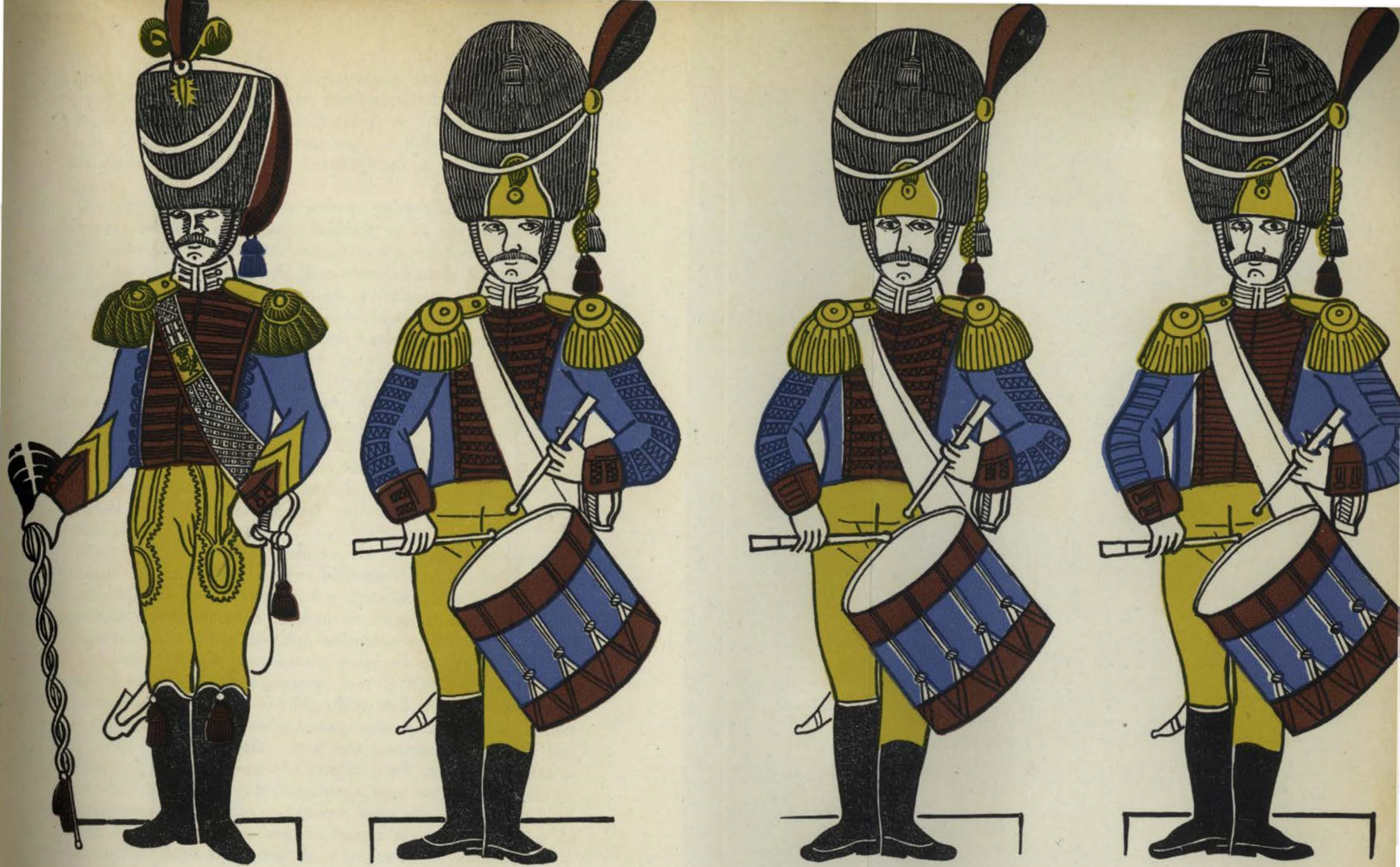
TROMMELAARS VAN DE KONINGLIJKE GARDE (±1860)