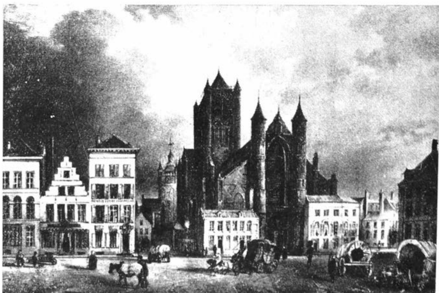
Gent. De Koornmarkt, standplaats voor diligences. Omstreeks 1835.