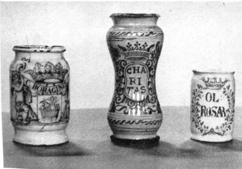
Voorbeelden van speciale siermotieven. (Nrs 23, 145, 17), op Delftse apothekerspotten der verzameling.