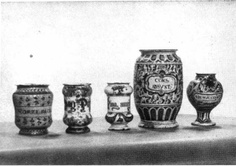
De vijf apothekerspotten uit het Museum voor Folklore, die van niet-Delftse oorsprong zijn. (Nrs 112, 156, 155, 120, 147).