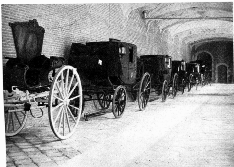
Tentoonstelling van het Vervoer. — Gent. Zicht op de koetsen en 'rijtuigen in de Noorderpandgang van Sint-Pietersabdij. Vooraan een Whisky (18 e eeuw). — 2. Koets der familie Stalins. — 3. Koets van de Gouverneur van Oost-Vlaanderen (19 e eeuw).