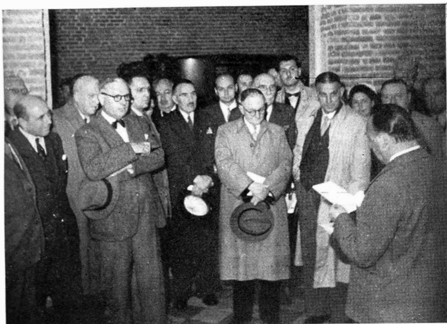
Tentoonstelling van het Vervoer. — Gent. Sint-Pietersabdij Gent. — Openingsplechtigheid, 15 Juli 1951.