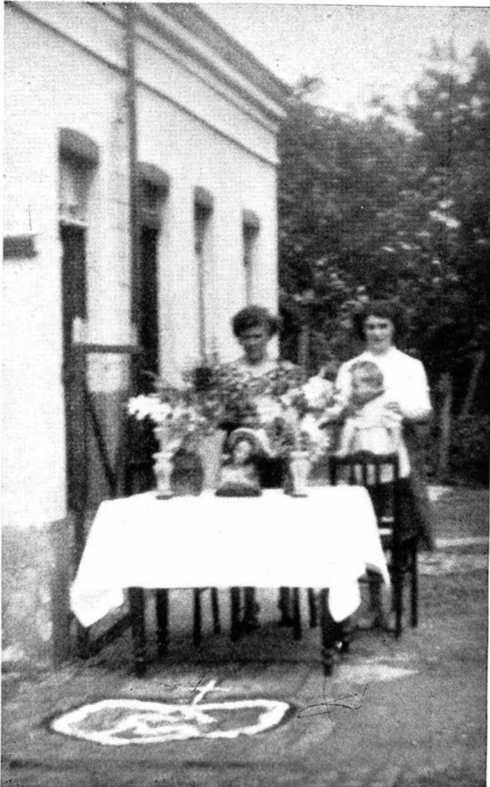
ELENE. — Processie van O. L. Vrouw Halfoogst.

Uitgestald O. L. Vrouwbeeld in de inrij van het erf. (Het huis is met de zijgevel naar de straatweg toe gekeerd). Achter de tafel staan twee stoelen, waarop de inwoners knielen als het Allerheiligste voorbijkomt. Opname te Elene, wijk Nieuwege.