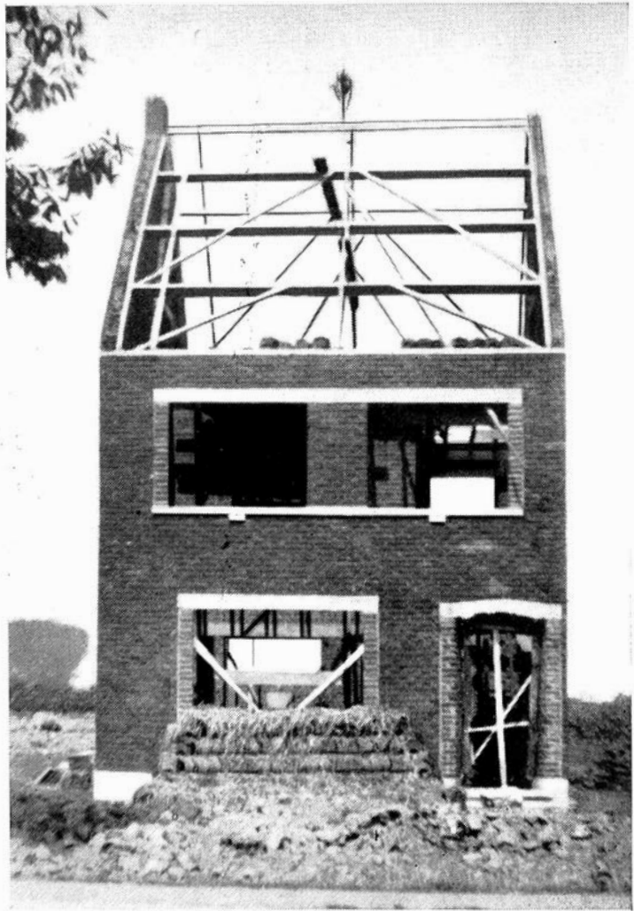
VELZEKE-RUDDERSHOVE. — De MEI op het dak. Opgenomen op de Grote Steenweg Oudenaarde-Aalst.