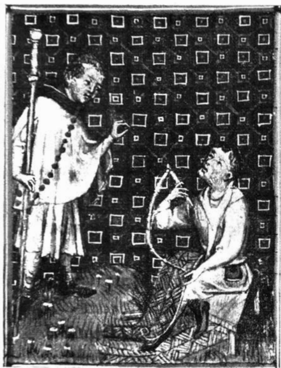
Plaat 1. — Werkende Mattenmaker. Miniatuur uit « Le Songe de Vie Humaine » van Guillaume de Digulleville. (ca 1380-1390) mogelijke herkomst: Vlaanderen. Hs. 10176-78, f° 55v o . Koninklijke Bibliotheek van België, Brussel