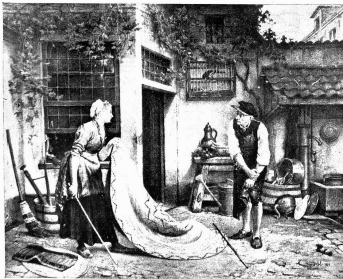
Plaat 2. Mattenkloppers. Schilderij door David Col, Antwerpen c. 1872. Privaat bezit.