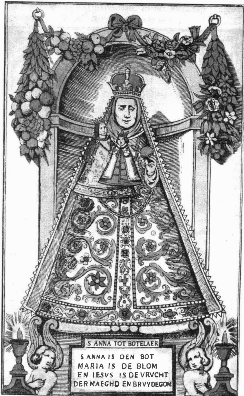
Fig. II. — Houtgravure met de voorstelling van St. Anna, vereerd in de kerk te Bottelare.

Gent. Museum voor Folklore, Vander Haeghenfonds.