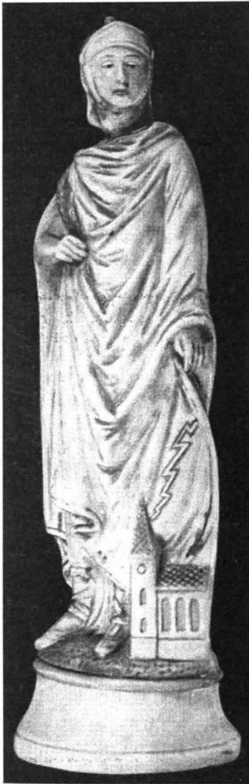
Afb. 36 Beeldje van de H. Donatus in de huizen te Woumen (W.Vl.)

blieke verering bescherming in het gebuurte te bekomen tegen donder en bliksem. Af en toe, tot vóór enkele jaren nog, kwamen mensen de paternoster bidden opdat de veldvruchten van onweerschade zouden bevrijd blijven. De inwoners beweren dat sedert de oprichting van de kapel nooit meer hagelschade of blikseminslag in de omgeving plaats had.