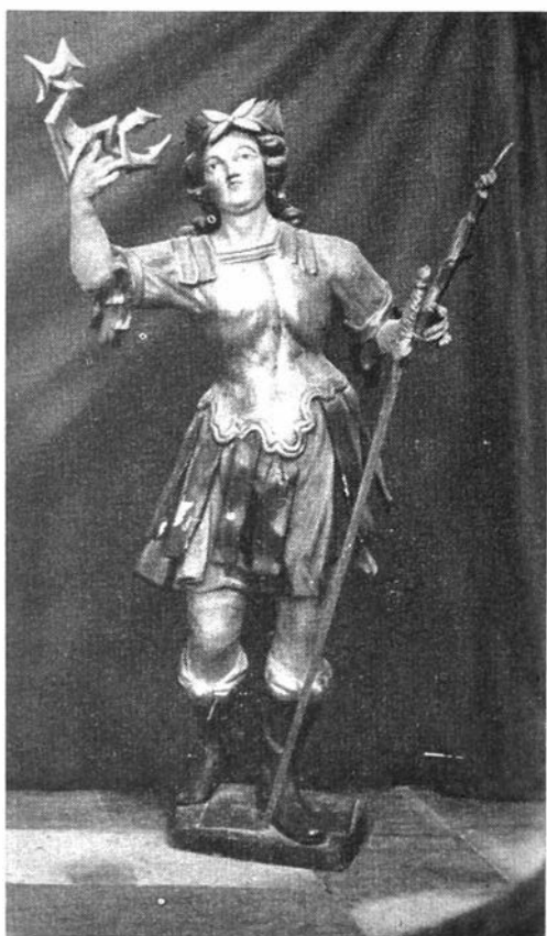
Afb. 34 Beeld van de H. Donatus (einde 1700) uit de Karmelietenkerk te Nieuwpoort; tot 1914 in de O.L. Vrouw-kerk aldaar.

Met de oorlog 1914-1918 verdween de devotie tot de H. Donatus in de O.L. Vrouwkerk te Nieuwpoort. De verering kwam uit de