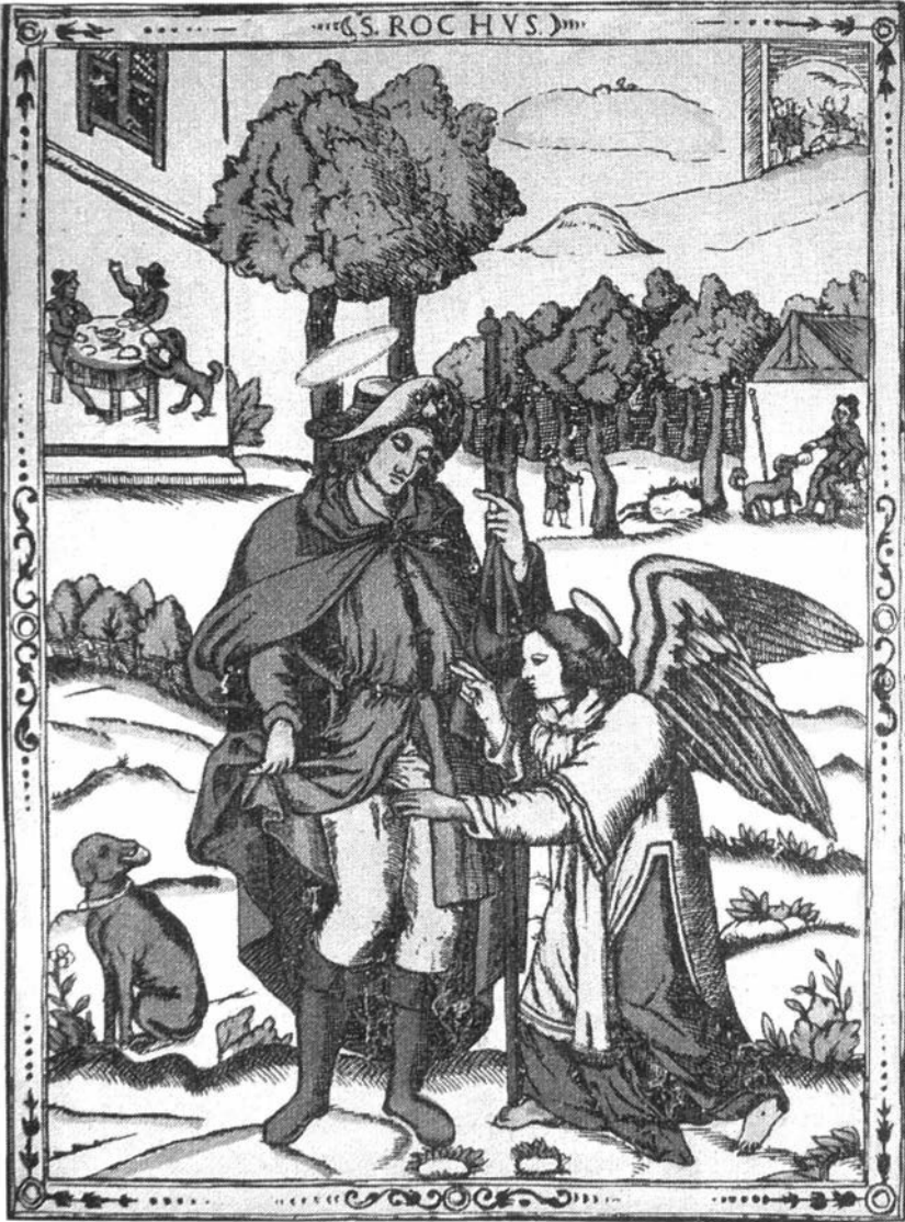
Fig. I. — Houtgravure, St. Rochus.

Gent. Museum voor Folklore, Vander Haeghenfonds.