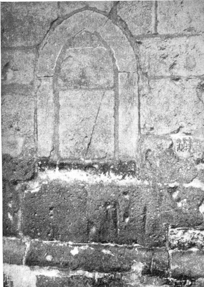
Gleuven in de muur der Ned. Herv. Kerk te Enschede bij de nu dichtgemetselde nis, waarin vroeger bij processies om de kerk de Monstrans werd geplaatst.