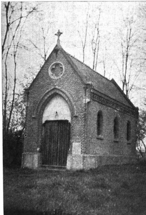
De St.-Kristianakapel, gebouwd onder het pastoorschap van E.H. Potjau.