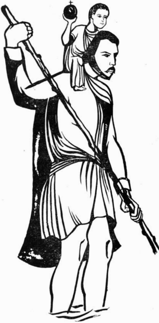
Fragment van het vaantje te Leuven.

Biezondere patroon tegen pest, cholera en alle dergelijke kwalen en ziekten, Biezondere patroon tegen onweders, bliksem, hagel en brand, Biezondere patroon tegen onvoorziene en onboetvaardige dood, Patroon tegen het overvloedig wenen der kinderen.(1)