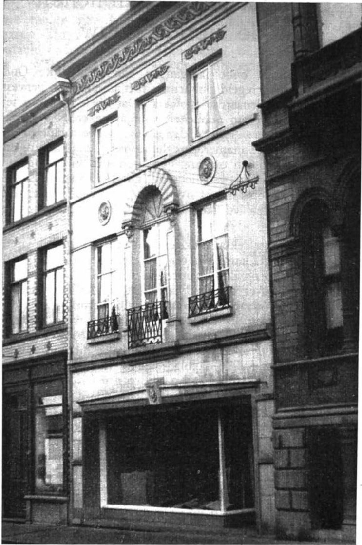
Dit huis in de Broodstraat stemt overeen met het vroegere « Gulden Ram ».

Van al deze geneesmiddelen werd dan gezegd dat ze te krijgen zijn bij een bepaalde apoteker van Oudenaarde, ofwel men volstond met de vermelding « in alle goede artsenywinkels van Belgenland ».