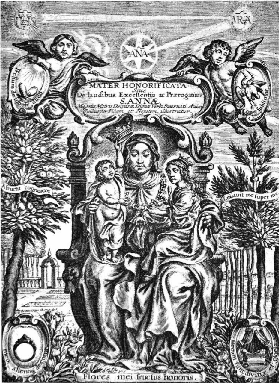
Mater honorificata-prent. Titelblad van een uitgave van « De heerlijkheden van St.-Anna » door Jan Trithemius.