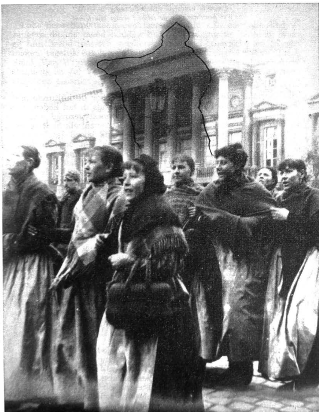
Wij, spinsters van de vlasfabriek...