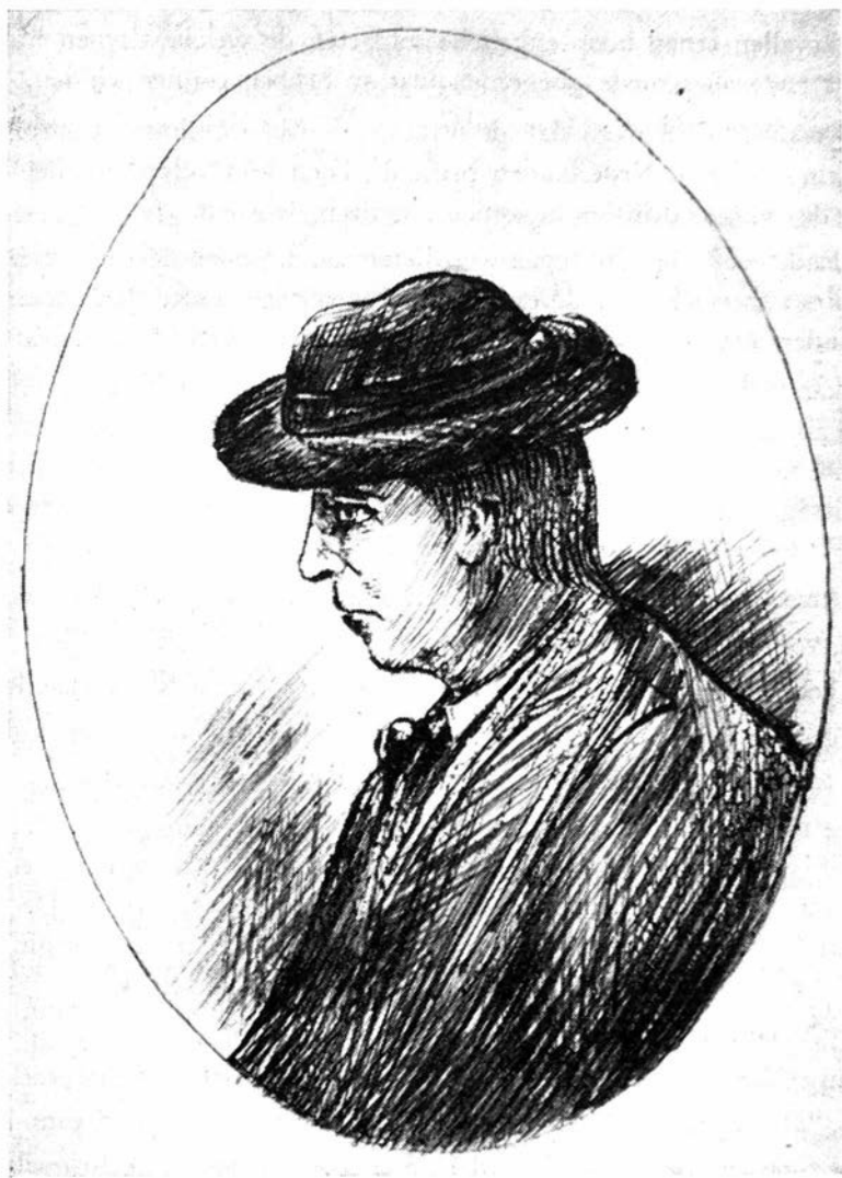
Jan de Lichte volgens een tekening uit die tijd.

twemaal veroordelen om geselsd, gebrandmerkt en verbannen te worden. « Voorbeelden trekken » en de eerstgekende diefstallen door Jan de Lichte gans alleen uitgevoerd, laten veronderstellen dat hij toen eigenlijk niets meer moest leren. (De diefstallen hadden plaats te Strijpen en te Breivelde (thans Grotenberge), de laatste geschiedde met inbraak en wapendracht). Trouwens, toen hij ongeveer veertien was werd hij op diefstal betrap op de jaarmarkt van Wetteren (1737).