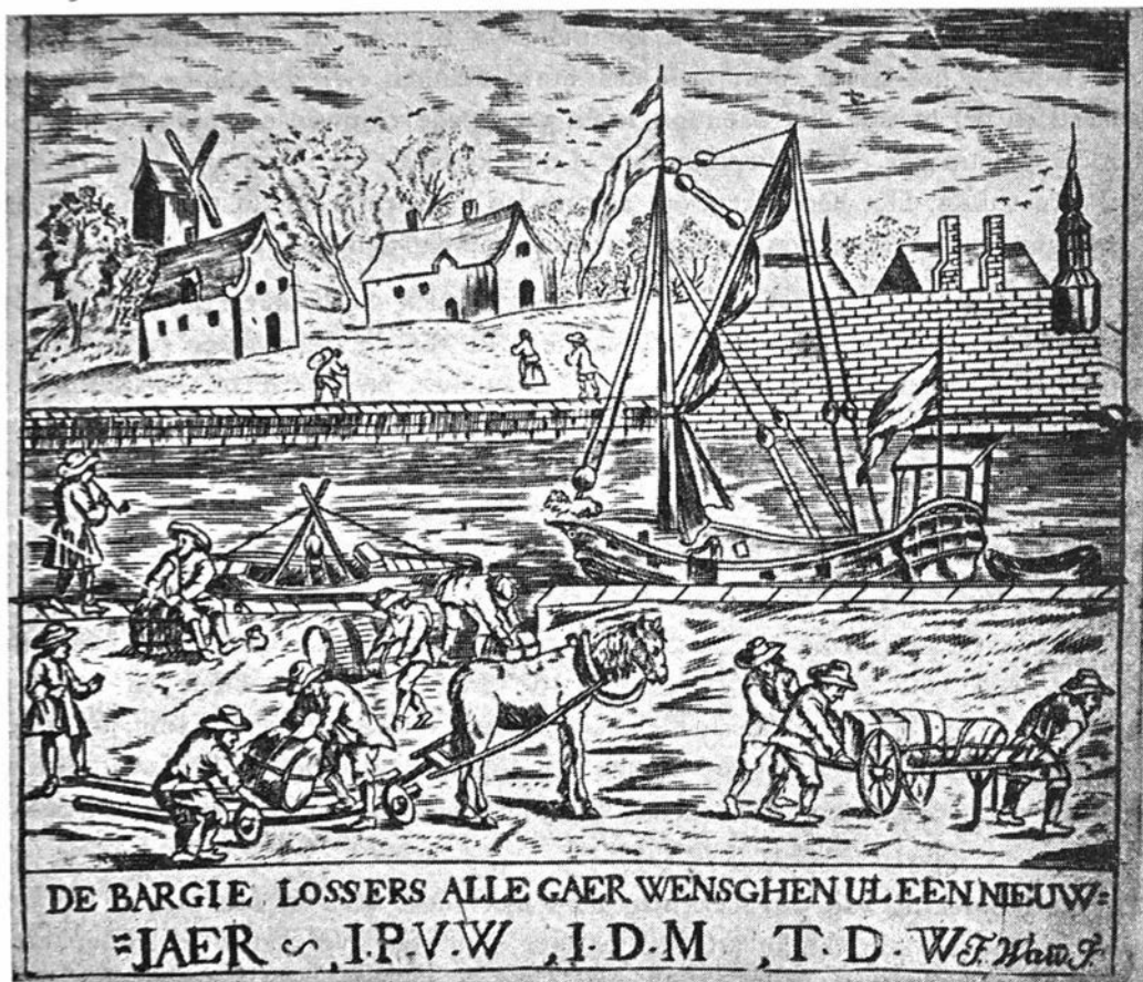
Nieuwjaarswens van de Gentse « Bargie-lossers ». Kopergr., XVIIIe eeuw

Op dergelijke wijze kunnen we even de waarde van de profane volksprenten aanhalen.