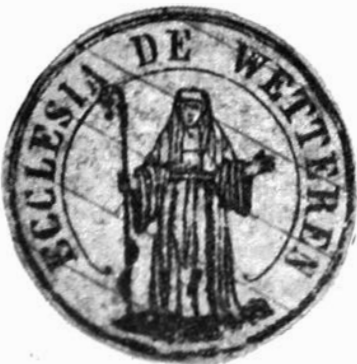
Afb. 6. — Kerkzegel Wetteren

Het beeld van St. Gertrudis bevindt zich ook in de zegels van het kerk- en gemeentebestuur.