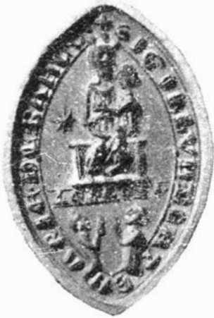
Afb. 3. — Zegel van de leproserie « TER BANCK » XIIIe eeuw. (Kon. Bibl. Brussel)

Het parochieblad van Erps-Kwerps van 22 februari 1956 bevat volgende stukje geschiedenis over het plaatselijke leprozenwezen: Quarebbe: Buiten de plaatselijke siechuyzen voor melaatsen, bestond er een grote leproserie te Ter-Banck, die door Hendrik I. Hertog van Brabant, onder bescherming werd genomen in 1217 en bestuurd werd door zusters Augustinessen. Werd er iemand te Leuven, of in de omgeving, van melaatsheid verdacht, dan werd hij naar Ter-Banck gestuurd om er aan een streng onderzoek onderworpen te worden. De moeder-overste en de twee oudste zusters verklaarden dan of de patiënt, ja dan neen melaats of pestlijder was. Zo ja dan stond hij voor de keus: ofwel blijven in Ter-Banck, mits de kloosterregel van Sint Augustinus te volgen, ofwel hier of daar in een dorpslasery zijn onderkomen zoeken en daar afgezonderd leven.