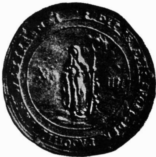
Afb. 7 : Oud gemeentezegel Archief Gemeentebestuur Wetteren

Het oude gemeentezegel, 42 mm. diam., bewaard in het archief van de gemeente, stelt de heilige voor in abdijsgewaad met een grote staf in de linkerhand door twee ratten beklommen; in de linkerhand draagt ze een boek. Links en rechts op het zegel staan de Romeinse cijfers X en IIII . Het inschrift luidt : dit is den seghel der prochie van Wetteren . Naar het oordeel van Jos. De Beer werden de cijfers X en IIII naderhand bijgevoegd. Die aanvulling geschiedde vermoedelijk wanneer Philips II de heerlijkheid Wetteren schonk aan Maximilien Vilain XIII in 1576 (48) .