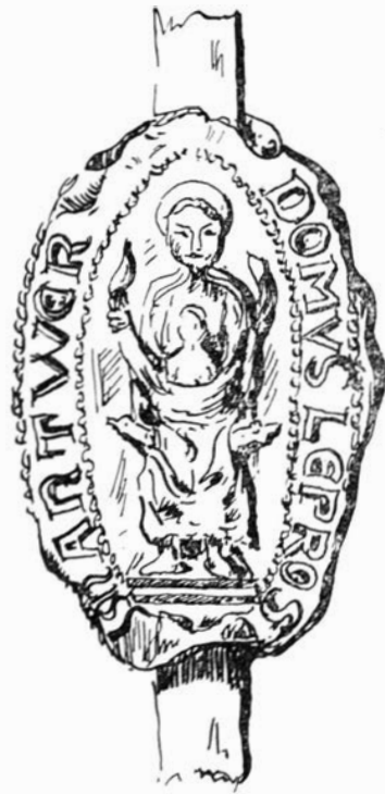
Afb. 4. —Leproserie ANTWERPEN XIIe eeuw

Een lepraschouwing bestond uit volgend onderzoek; eerst onderzocht men de aard van de wonden; dan trok men enige haartjes uit het hoofd en de baard of uit de wenkbrauwen en indien de wortels vleesachtig waren, werd men als melaats beschouwd. Tenslotte stak men een naald in de hals en de voetplanken en zo de kranke deze operatie niet voelde, was hij zonder enige twijfel melaats