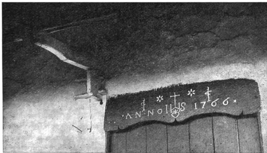
Detail van deurkalf, 1766, te Schorisse, afb. 499 van Band VIII. Kanton Sint-Maria-Horebeke.

Er ligt een afstand van twee decennia tussen aflevering I en VII-VIII. Het spreekt vanzelf, dat de opvatting over een repertorium gewijzigd is. Bij het vertrekpunt let de inspektrice op beschrijving van gebouwen en kunstwerken en voorwerpen van historisch of oudheidkundig belang. Op dat ogenblik beschouwden de diensten en vorsers gewoonlijk 1830 als een tijdslimiet. Aflevering VII beduidt een kentering, want werken uit de negentiende en zelfs uit de twintigste eeuw zijn opgenomen, wanneer ze een lokaal belang of een voornaam ensemble vertegenwoordigen. Bodemonderzoek hoort niet in het raam van monumentenbeschrijving, maar zichtbare aardewerken zoals de ruïne van een voormalig kasteel te Roborst komt aan bod. Verdwenen gebouwen en voorwerpen krijgen een beurt om een totaalbeeld inzake kunsttopografie tot stand te brengen. Archiefonderzoek wordt ingeschakeld. Het beeld van het dorp volgens het kadaster ruim honderd jaar geleden wordt regelmatig geschetst. Het huidige dorpscentrum, de situatie van de kerk in het dorp, de inplanting van kerk en kerkhof, de vergelijkingskans tussen de foto van een heiligdom en een kunstwerk (zo voor Rozebeke, afl. VIII, 336-337 tekening A. Heins van 1901), de roepsteen, het woongebouw van een gesloten hoeve, de kenmerken van van een deurkalf, (ill. 437, 449) schandpalen en wapenschilden en talrijke andere