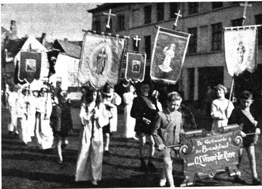
Processie op weg naar St.-Pieterskerk, komend van de hoek St.-Hubertusstraat-St.-Kwintensberg.

Voor een tiental jaren hoorde bij de kapellekensviering de processie naar O.-L.-Vrouw-ter-Rieve in de St.-Pieterskerk. De eerste zondag na halfogst trok men in processie van uit de Brandstraat naar het St.-Pietersplein. Een vijftigtal personen, bestaande uit burens met een groep kinderen, paters en zusterkens trokken ter beevaart met twee pestkaarsen naar O.-L.-Vrouw-ter-Rieve waar een H. Mis