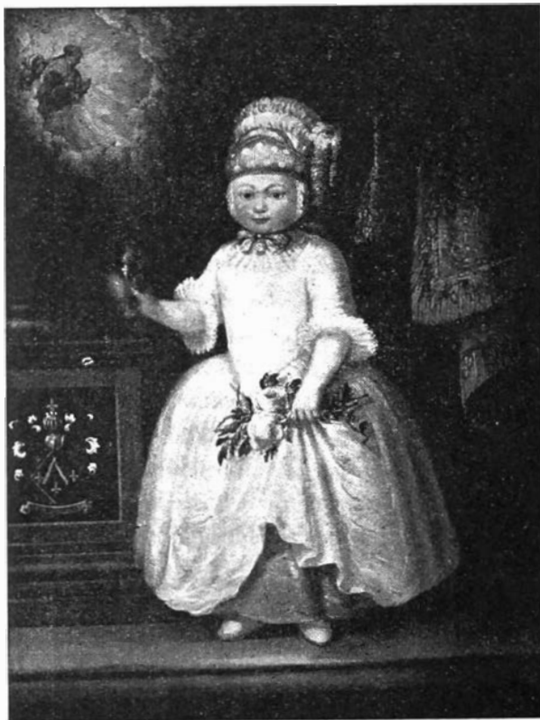
Votief kindportret uit 1774 met wapenschild van de familie Parmentier, afb. 140 van Band IV. Dendermonde.

stond belang voor de studie van de nederzetting, maar tevens voor de bescherming en handhaving.