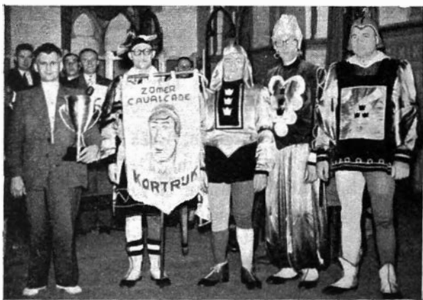
Gedeeltelijk verklede groep uit de Driekoningenstraat te Sint-Niklaas met deelnamevaandel van de zomerkavalkade van Kortrijk.

De reuzen waren in de ware zin van het woord "koningen". Andere reuzen beelden een of ander persoon uit, maar de reuzen van de Driekoningenstraat hadden onmiddellijk een ongewone allure en betekenis. Elkeen begreep terstond hun houding en uitrusting en waarde. Het ligt voor de hand, dat ze alom, zowel in binnen- als buitenland meer dan gewone bijval oogstten.