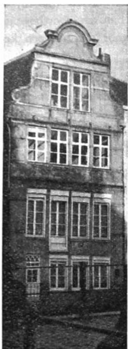
Het huis Roeges aan de Leic, gezien van het Groot Kanonplein.

is de moeite van het vermelden wel waard.