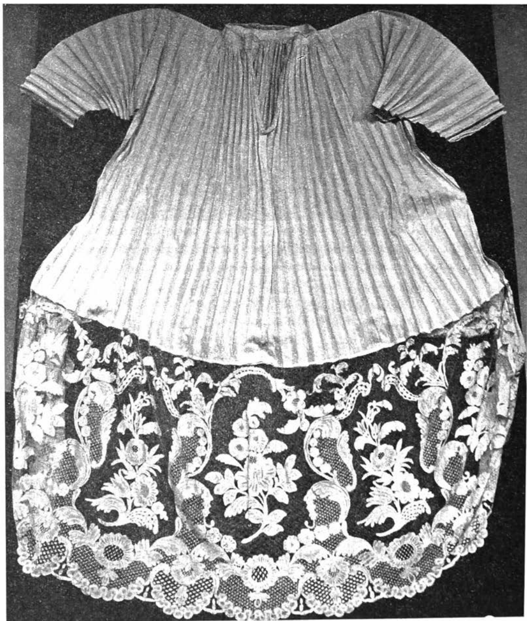
Afb. 5 : Ensemble albe met Gentse kant

Zoals bij elke tentoonstelling doe ik een beroep op de aanwezigen om voor ons museum en voor deze expositie propaganda te maken in hun omgeving. Kom met vrienden en verwanten naar het museum, introduceer ze in de edele kantwerkkunst of wees hun gids door uitleg te verstrekken over de vele in het museum tentoongestelde voorwerpen en dokumenten.