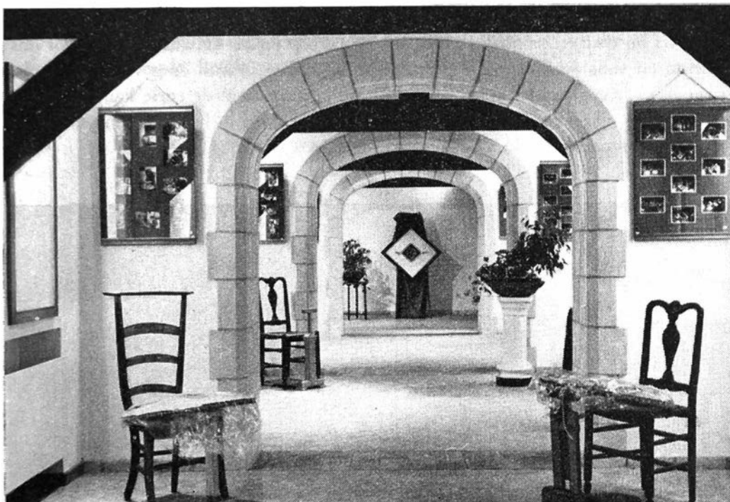
afb. 4 : Een blik op de tijdelijke tentoonstelling over kantwerk in de speciale expositiezolder van het museum die tevens een van de leslokalen voor de kantwerksters is.

voor volkskunde. Het is een vererende opdracht voor de cursusleidsters dat dit aspect zo veel als mogelijk op het oog wordt gehouden.