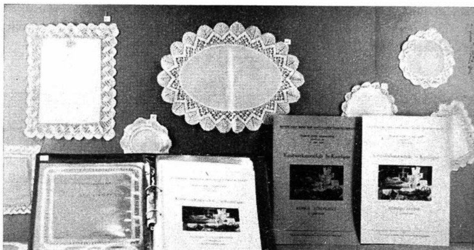
Afb. 2. — Een van de uitstalkasten met werkjes van de klubleden en de kursusboeken

wier belangstelling was opgewekt door de werking van de klub, hun goede diensten aanbieden. Ook kwamen stilaan meer orde en doorzicht in de methode voor het lesgeven, problemen die werden uitgewerkt en opgelost naarmate de ondervinding groeide. Vandaar ook het totstandkomen van de kursusboeken met technische tekeningen die het aanleren van het kantwerken uitermate zullen bevorderen.