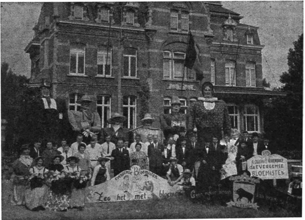
Debbaut's reuzen 1963

De geplande hervorming heeft voor gevolg dat de namen van de reuzen worden gewijzigd. De naam Bacchus de Zolderman wordt eenvoudig vervangen door de benaming van de eerste stamvader — van 1936 — reus Dokus. Beide kinderen van Dokus en Isabella worden Jacobus en Jacoba genoemd.