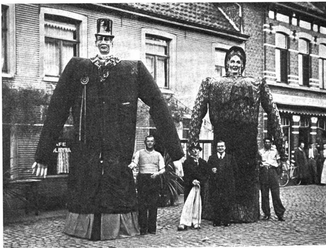
Dokus en Isabella 1949

De eerste periode dateert van vóór de oorlog 1940-1945. Evergem Hoeksken kent omstreeks 1936 een sterk buurtschap. Jaarlijks met de kermis hebben allerlei volksfeesten plaats; de reuzen Dokus en Isabella doen hun intrede op de wijk, feitelijk geen nieuwe reuzen. Het feestcomité had ze afgekocht van het feestcomité Gent-Muide. Jaarlijks gaan ze rond op 't Hoeksken, in Hekstraat en Schoonstraat. Het oorlogsgebeuren stelt een einde aan de rondgang. De reuzen verdwijnen uit het ontspanningsleven.