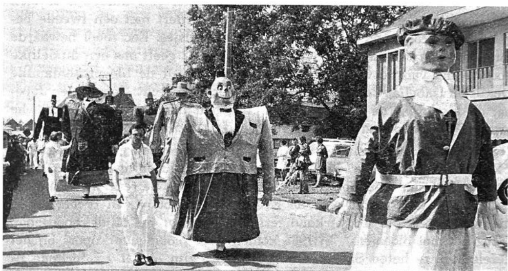
Sabbas en Pierken

Op 23 juni 1963 beleeft Gent de grote triomftocht der reuzen in Vlaanderen. De Debbauts reuzen, bestaande uit zes reuzen en de boorling met de twee begeleidende groepen, worden de eerste geclasseerd en ontvangen uit de handen van de jury de ereprijs.