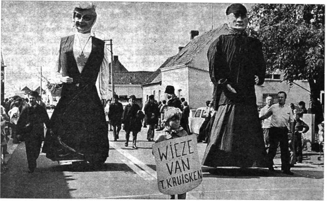
Wiesken en Pompom

Wiesken en Pompom van de vereniging "Vreugde en Zorg" vormen een mooi paar. Ten alle kante worden ze uitgenodigd voor het opluisteren van feestelijkheden samen met de begeleidende groep "De Boerkens en Boerinnkens van 't Kruisken". Wiesken en Pompom behoren tot de volkstypen zoals men die overal aantreft. Wiesken heeft een ijzeren geraamte en weegt ongeveer 30 kg. Het lichaam van Pompom is uit latwerk vervaardigd.