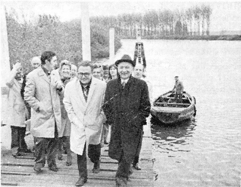
De laatste groep na het bezoek aan "Luc de Veerman".

Na het tekenen van het Guldenboek van de gemeente werden de voormiddagactiviteiten besloten met een tocht naar Appels-veer, zo genoemd naar eeuwenoude traditie van de bewoners.