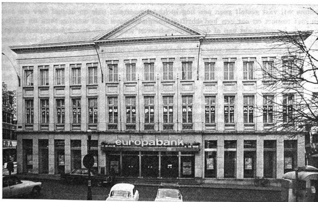
Afb. 2 — Herstelde gevel aan de Groentenmarkt, Gent, door de N.V. EUROPABANK naar de oorspronkelijke plans van Joachim Frans Colin

Wanneer de N.V. EUROPABANK zich te Gent op de Groentenmarkt vestigde, werd de verminkte gevel praktisch bijna naar de originele plans hersteld en is Gent met de plechtige inhuldiging van de bank op 30-3-1965(23) een historisch gebouw rijker geworden.