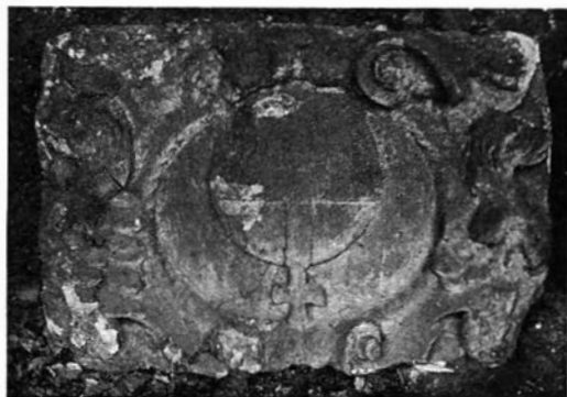
Afb. 3 — Gevelsteen "Den Rooden Hert" (1968) Lange Munt nr. 12, Gent