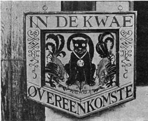
Afb. 1 — Uithangbord "In de kwae Overeenkomste" (1913) (Museum voor Volkskunde, Gent)

Uithangborden waren dikwijls met figuren beschilderde plankjes boven de winkeldeur bevestigd of plaatijzeren schilden die aan metalen, smeedijzeren galgjes aan de gevels hingen(1). Soms waren die figuren gewoon op de deuren of de gevels geschilderd, later ook op de ruiten. Ook werden er nagebootste voorwerpen (van hout, metaal enz.) uitgehangen (rapen, vingerhoeden e.d.m.). Rijmen en opschriften kwamen bij de geschilderde figuren vaak voor. Karakteristieke windijzers worden soms bij de uithangborden vernoemd, b.v. het 'Scheepke' boven het gildehuis der onvrije schippers te Gent. Gevelstenen zijn ook uithangtekens.