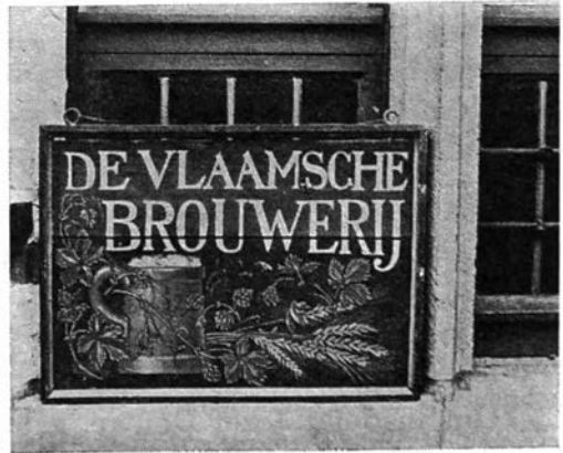
Afb. 2 — Uithangbord "De Vlaamsche Brouwerij" (1913) (Museum voor Volkskunde, Gent)

Oude gevelstenen zijn reliëfs die meestal in zandsteen zijn vervaardigd. Ze werden oorspronkelijk als benamingsteken, huismerk, in de gevel van huizen en corporaties gemetseld, ter hoogte van de eerste en/of de