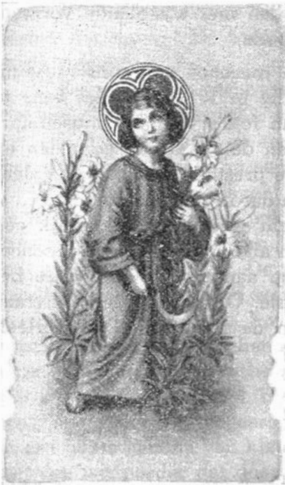
Afb. 1 — Kindje Jezus snijdt met een sikkeltje lelies af.

Het betreft een prentje van kleine afmetingen, 7,8 cm hoog en 4,3 cm breed, dus helemaal aangepast aan het kerkboekje dat wij ter gelegenheid van onze eerste communie kregen, zodat het erin kon worden bewaard. Het is gedrukt in Italië, merk NB in een ruit K/6160; afbeelding 1). Het kindje staat er liefelijk afgebeeld met een gouden nimbus tussen witte lelies. In de rechterhand houdt het zijn sikkeltje vast en de linkerhand drukt een lelietak tegen de borst, een onschuldig zieltje. Met deze beloning ging voor mij een nieuwe wereld open. Thuisgekomen mocht ik in moeders kerkboek even