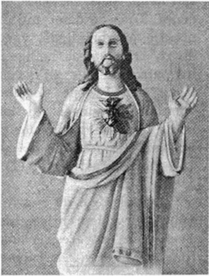
Afb. 3 — Heilig Hart van Jezus

Het vierde prentje (afb. 3) staat in verband met een godvruchtig gebruik dat zijn oorsprong vond in de twaalf beloften van Onze-Lieve-Heer