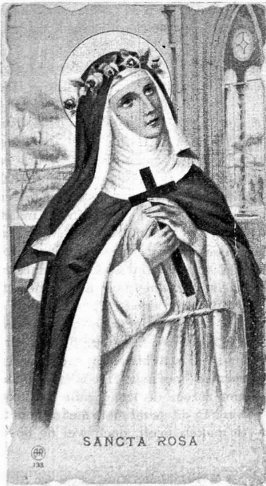
Afb. 2. — Heilige Rosa