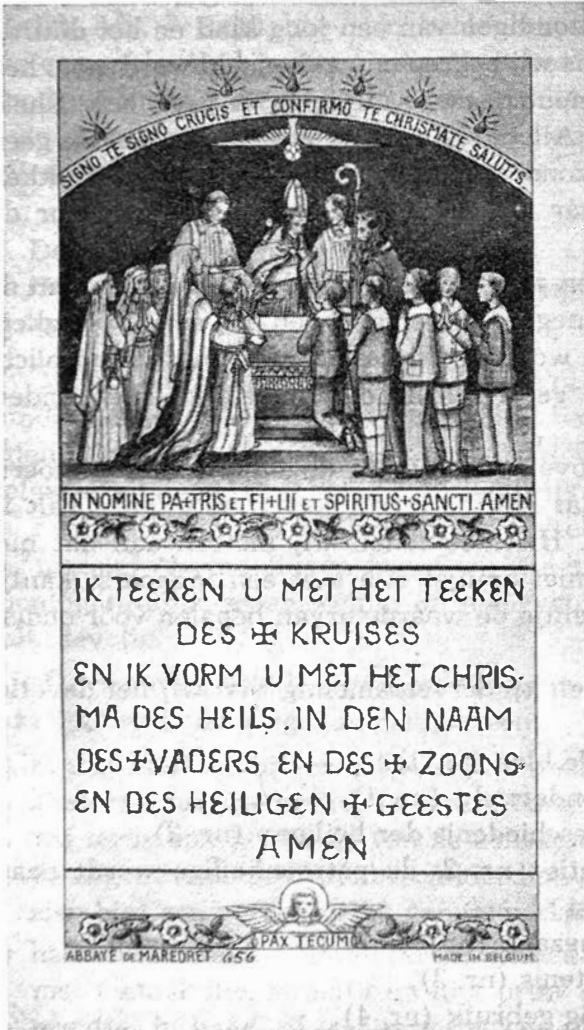
Afb. 4 — Toedienen van Vormsel