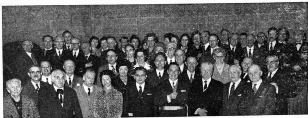
Afb. 1 — Groepsfoto bij de ontvangst op het Gentse stadhuis

Met een heildronk en de ondertekening van het Gulden Boek van Stad en Bond eindigde de gezellige ontvangst met de opname van een groepsfoto, zie afb. 1.