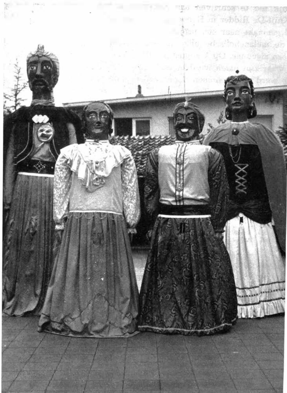
Afb. 13 — Wichelen. Moriaan, Esmiralda, Iraldo en Sarida