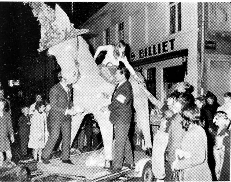
Afb. 11 — St.-Amandsberg 1971, Ezelsfeesten

De reuzendieren van 't Ezelsfeest. — In het folklorejaar 1974 werden de 14de Ezelsfeesten gevierd. Het ontstaan van deze feesten hebben we reeds vroeger behandeld(34). De Dendermondsesteenweg, de Heirnis en de gehele H. Hartparochie beleefden drukke dagen. In de jongste tien jaar heeft de stoet heel wat uitbreiding genomen. Op zaterdag