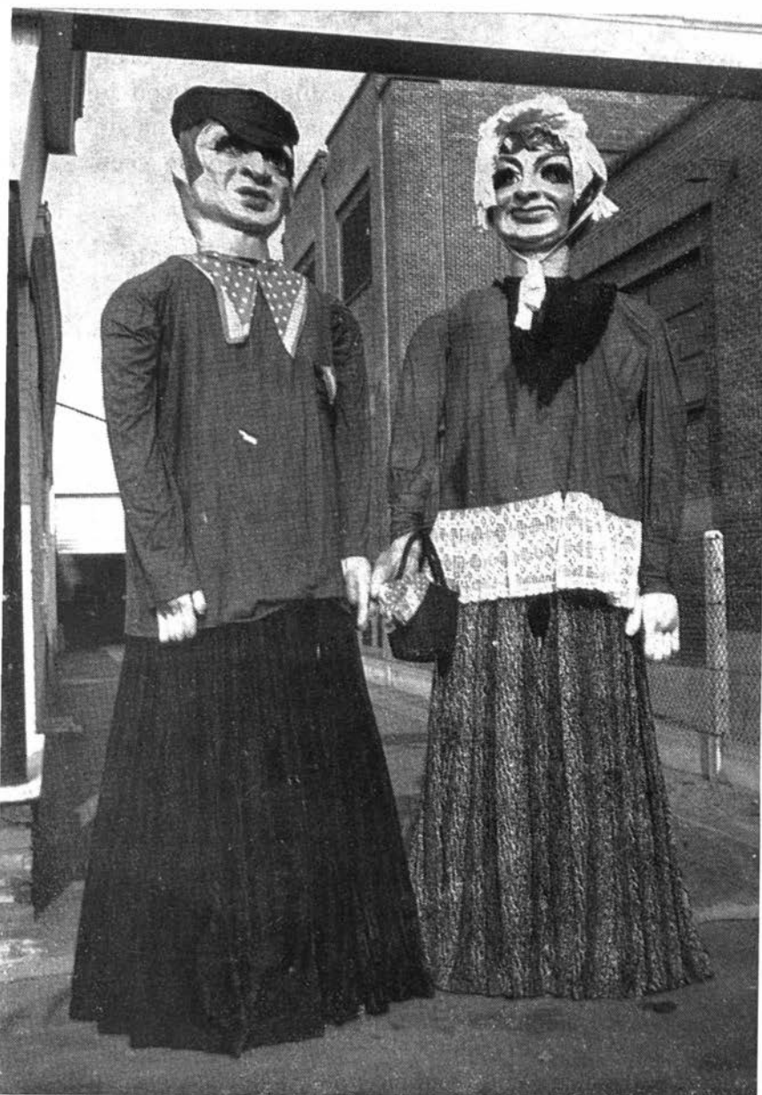
Afb. 6 —