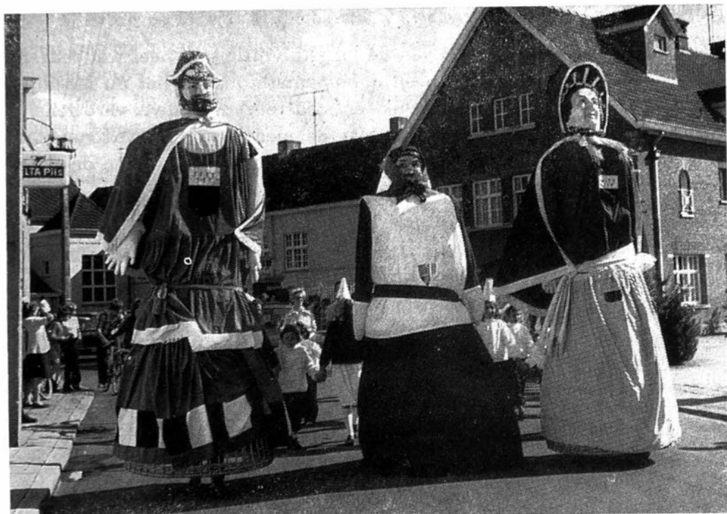
Afb. 5 — Heusden 1974, Inhuldiging reuzenkind