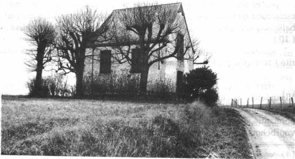
De kapel van O.-L.-Vrouw van Zeven Weeën te Steenhuize. Anno 1781 ge(her)bouwd.