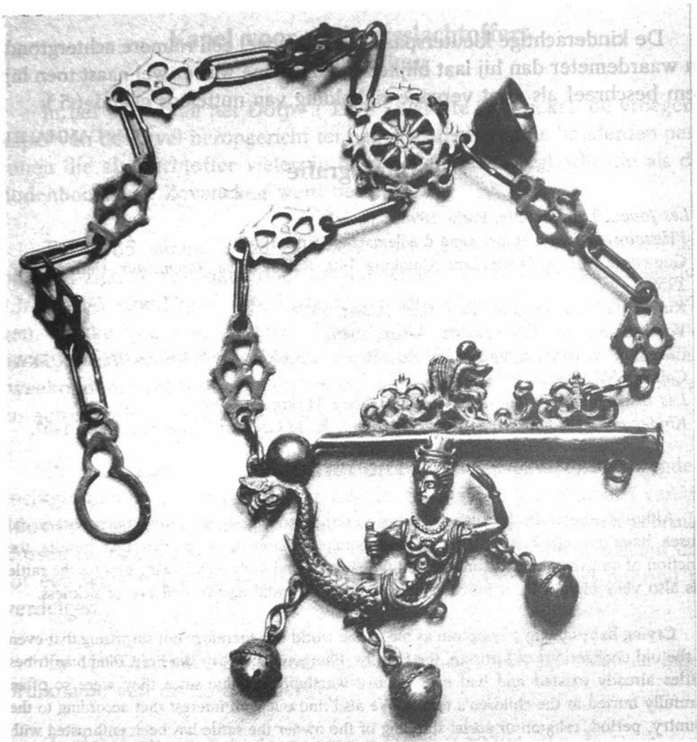
Zilveren Sirene rammelaar, met fluit, gedeeltelijk verguld, Spaans 17 e eeuw

fose van de rammelaar volledig gebeuren, bij de laatste stuipen blijft er slechts een ivoren of parelmoeren bijtring over met een zilveren rinkelbel, om dan volledig te sterven in de vorm van celluloid en plastic.