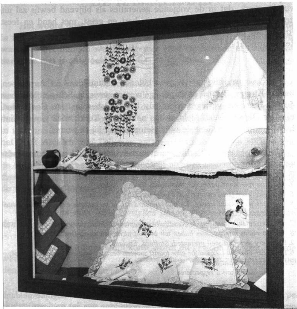
Kijkkast met kantwerkstukken.

In die zin zitten alle leden van de Kantwerkster klub Sint-Katelijne éinig en samen, innig en kunstzinnig, in dit wonder prachtwerk.