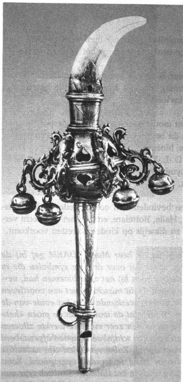
Zilveren rammelaar, konzolen in griffoenvorm, wolfstand en fluit, decoratie in gravure, Augsburg, begin 17 e eeuw.