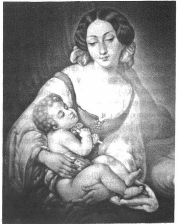
Litofanie : Moeder en kind met rammelaar