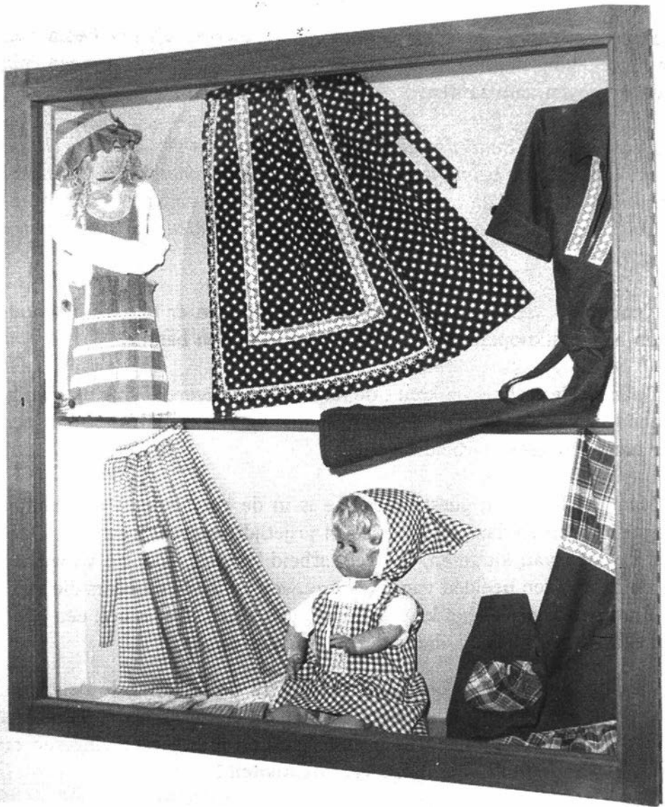
Kijkkast met kantwerkstukken.

Daar ligt de hóógstaande en vóóranstaande band : dat elk lid van de Sint-Katelijne Kantwerkclub uitgestegen is boven zichzelf, én boven de anderen, in het dienen van de goedheid en de schoonheid tegelijk : de goedheid en adel van het hart dat zich plooit naar de medemens en dat zich tooit met gemeenschappelijke verrijking, in het bereiken van een schoonheid die vér boven het alledaagse uitmunt.