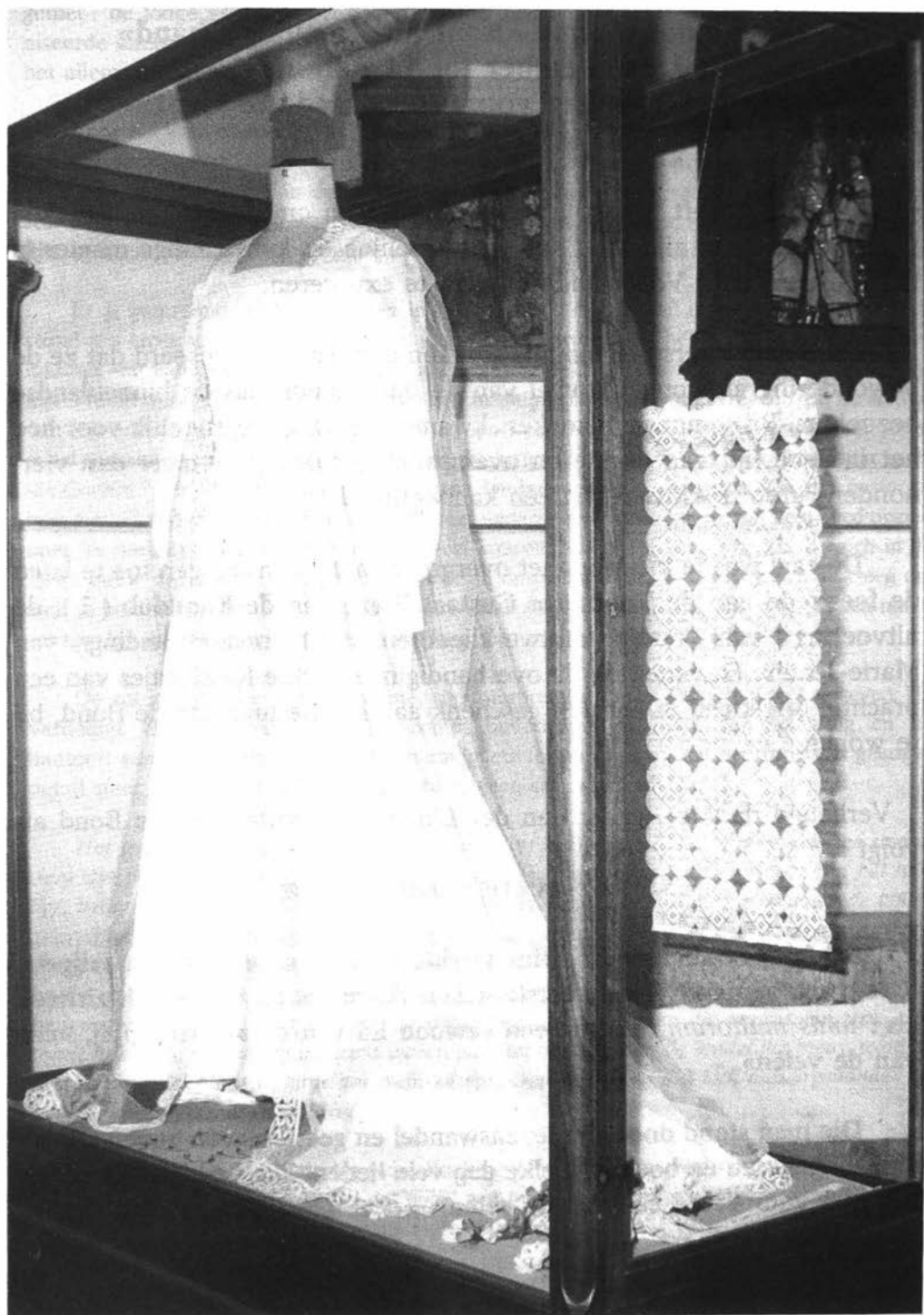
Kijkkast met kantwerkstukken