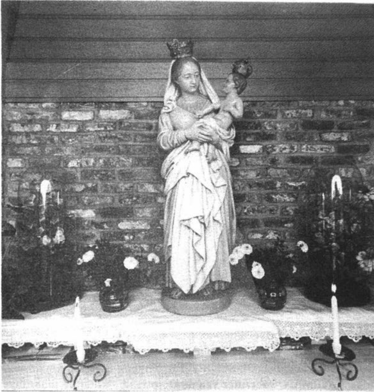
Het Mariabeeld in de kapel

kalligrafeerde de reeds bekende namen van de slachtoffer op perkament.