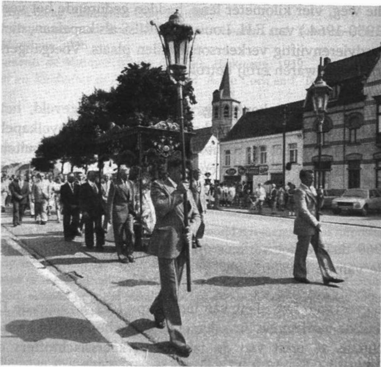
Na de dragers met flambeeuwen stapt E.H. pastoor onder het baldakijn dat voor de gelegenheid werd te voorschijn gehaald. Het voornemen bestaat om het bij andere plechtigheden opnieuw in gebruik te nemen.

Op Onze-Lieve-Vrouw ten Hemelopname werd het Mariabeeld ( ± 1860 ), uit de vroegere kapel, vanuit de kerk plechtig naar de nieuwe kapel gedragen. Aan de processie namen alle socio-kulturele verenigingen deel : voorop de Kruisridders van Exaarde-Doorslaar, dan vlaggendragers van alle verenigingen. De jeugdfanfare van Sint-Lievens-Houtem speelde gewijde muziek, de eerste-kommunikantjes strooiden bloemen op de weg, daarna volgden twee maal vier meisjes in uniform met het Mariabeeld, de plechtige kommunikanten met een roos in de hand, de majoretten, de geestelijkheid met het heilig sakrament, de hoogwaardigheidsbekleders en de genodigden. Met een autobus met bejaarden eindigde de stoet.