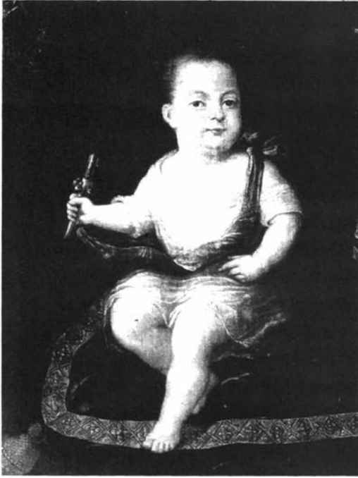
Detail van schilderij : Kind met rammelaar, onbekende meester, begin 19de eeuw. Rammelaar is vroeg 18de of misschien wel 17de eeuw.