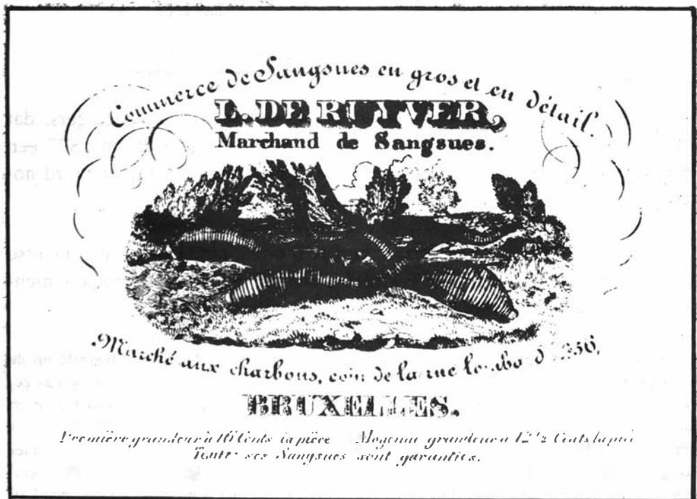
Adreskaart van bloedzuigerhandelaar L. De Ruyter Orig. afm. 176 x 128 mm

In de bloeitijd van het gebruik van echels ontstond een bloeiende handel. In het stadsarchief van Brussel ontdekten wij een reclamekaart van een handelaar in bloedzuigers. Het kaartje hierbij is afkomstig van de firma L. De Ruyter en is in het Frans opgesteld. Dit drukwerk laat niet aan duidelijkheid te twijfelen over de aard der goederen die in garantie worden geleverd.