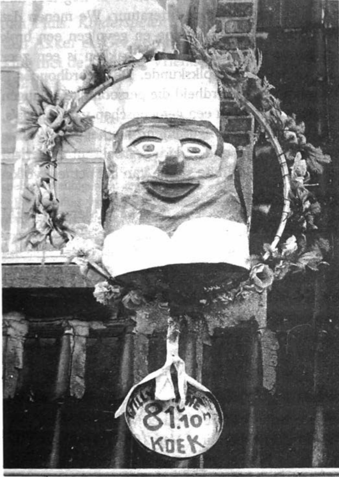
Reuzepop aan het huis