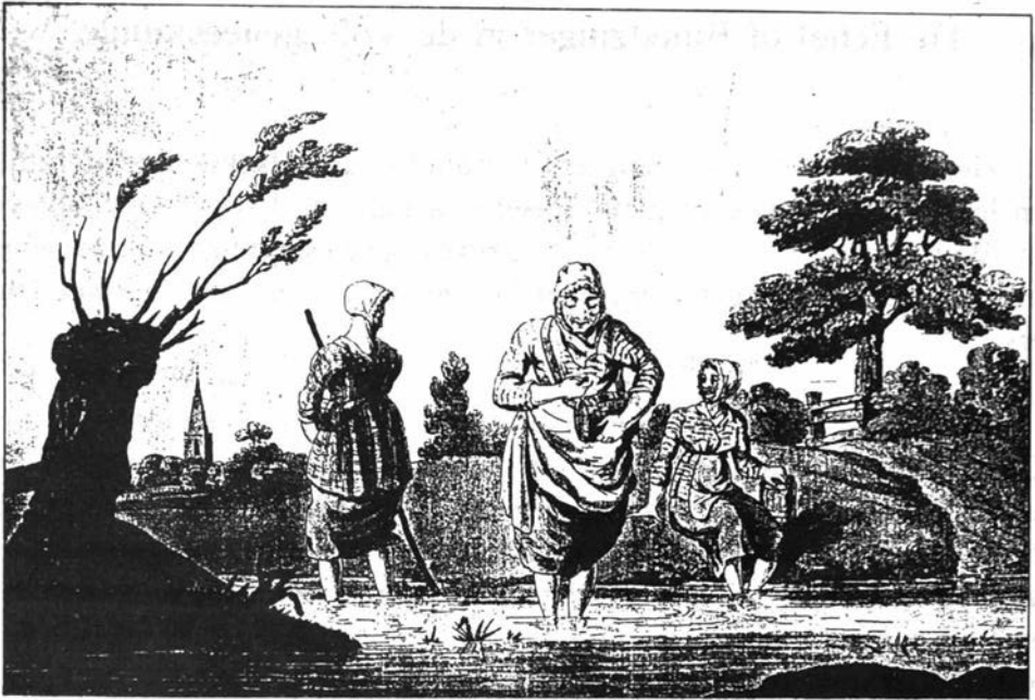
Het vangen van bloedzuigers