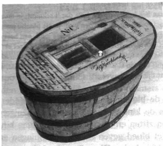
Kuip voor het bewaren van bloedzuigers Medicinhistoriska Museets, Stockholm