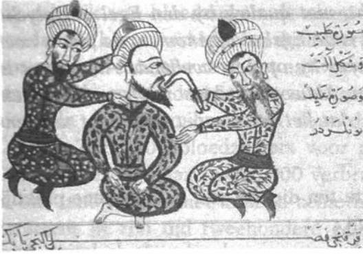
Bloedzuigers verwijderen uit de keel.

den wij in een 15 e -eeuws handschrift van de Universiteitsbibliothek Praag. Een ander voorbeeld van bloedzuigers te zetten op de benen om onderhuidse verzweringsen te behandelen is ontleend aan een 14 e -eeuws handschrift van Aldobrandino van Siena «Le régime du corps» dat berust in de Universiteitsbibliothek van Cambridge onder sigel HS 12323 ( 5 ).