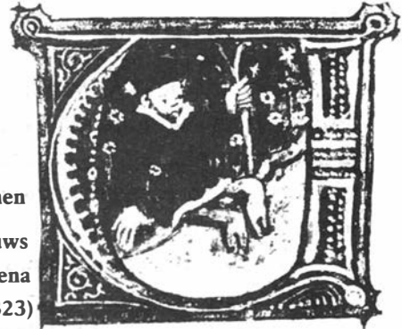
Bloedzuigers op de benen Initiaalletter uit een 14 e eeuws handschrift van Aldobrandino van Siena (Univ. of Cambridge, HS 12323)

Bloedzuigers werden in de middeleeuwen zowel in de geneeskunde als in de volksgeneeskunde gebruikt om pijnloos bloed te zuigen en zo een aderlating uit te sluiten. Het volk dacht dat samen met het weggezogen bloed ook de giftige stoffen verdwenen; deze gedachtengang vond bij het volk inslag, omdat het gezogen bloed in de maag van de diertjes aanstonds zwart kleurde.