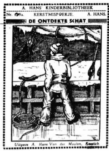
Enkele nrs. gegroepeerd rond Kerstmistema.