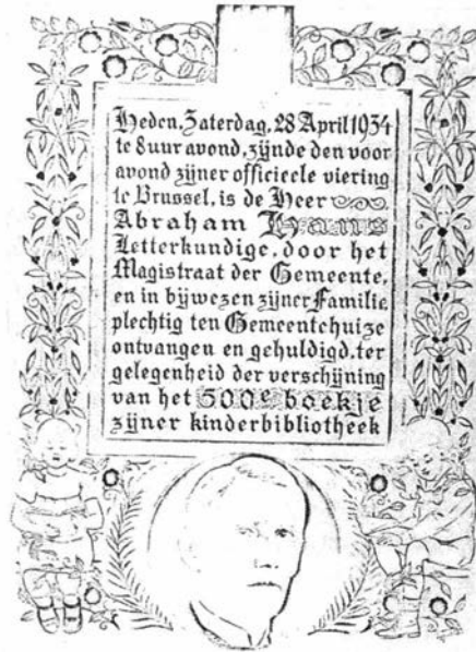
Blad uit het kunstzinnig Guldenboek te Kontich.