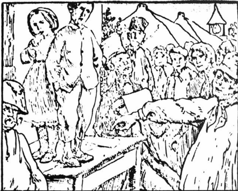
Pentekening Edmond Van Offel. Illustratie ontleend aan Uit Grootvaders Tijd . Vlaamsche Boekhandel. Lodewijk Opdebeek, Antwerpen, 57.

- Dat arm schaap moest met de leurster mee door wind en regen, vorst en sneeuw, ook door de bitte . . . Met haar tere handjes droeg ze een zware korf. En als Mietje moe was en niet meer voort kon, kreeg ze stompen en schoppen.