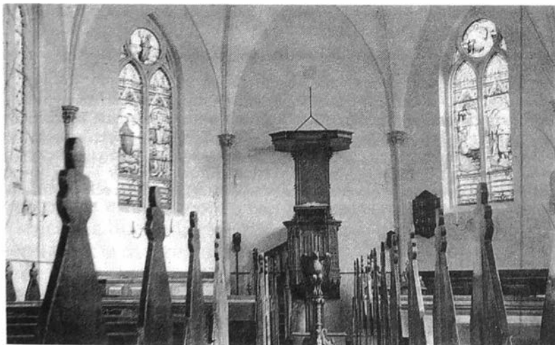
Interieur van de kerk.

Het ligt voor de hand, dat de school [de leerkracht(en)] een belangrijke en gebeurlijk verstrekkende invloed kan uitoefenen. In de besloten gemeenschap van Horebeke oefende een beperkte groep een felle controle uit, nl. de kerkeraad. Deze raad was verantwoordelijk voor de gave, goede zeden, de «censura morum», toezicht op het gedrag. De raad spaarde niemand. In 1843 zendt hij de schoolmeester wandelen, «wegens berispelijk gedrag».