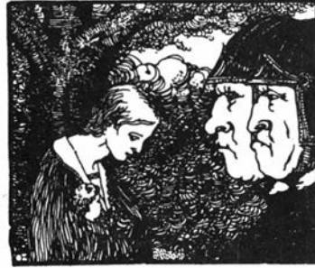
Uitgave A. HANS-VAN DER MEULEN, Contich

Bij een heruitgave kwam soms een andere illustratie opduiken, zo voor Geneveva van Brabant, nr. 171.