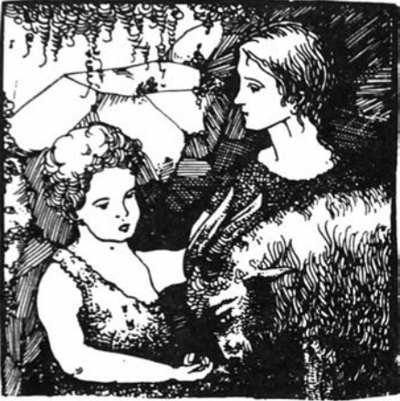
Uitgave A. Hans-Van der Meulen, Contich.