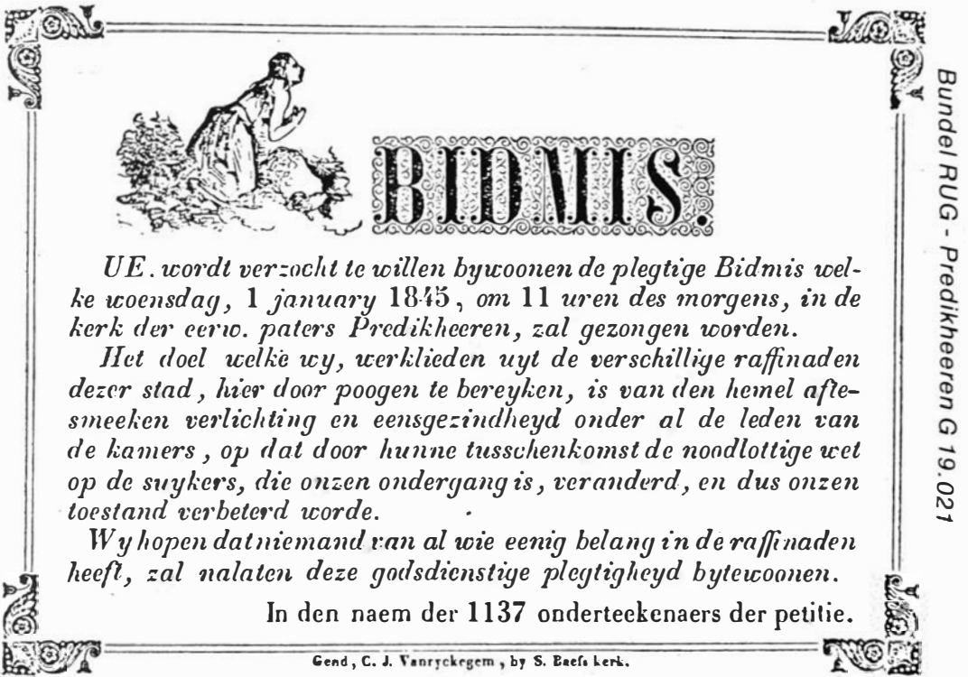
Afb. 2. Uitnodiging tot bijwonen van de bidmis.