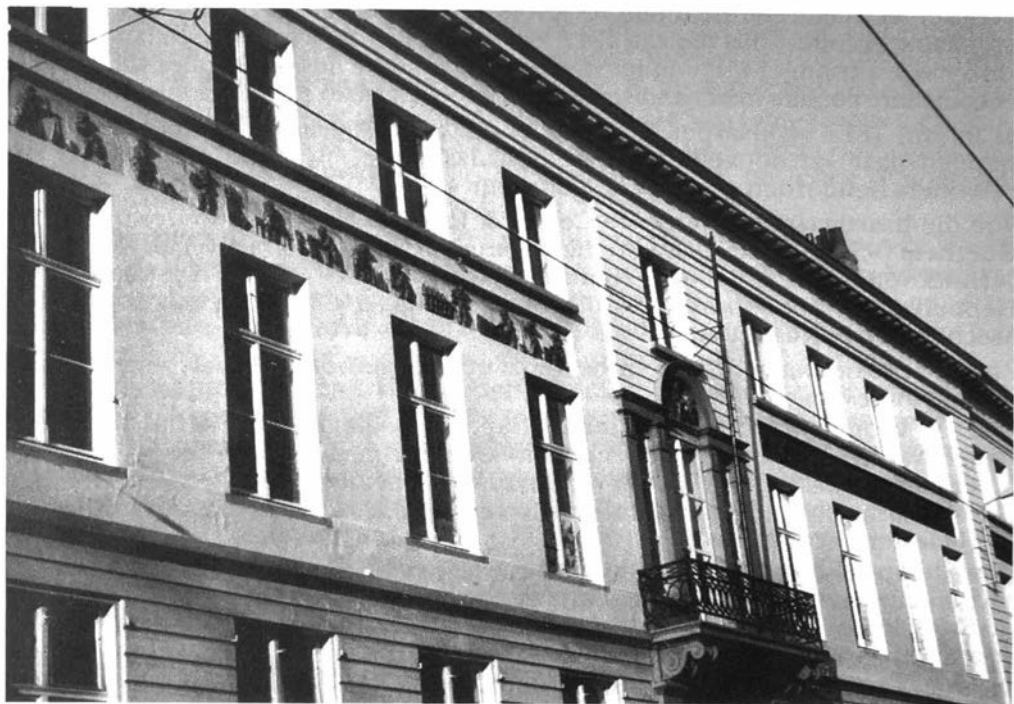
Afb. 1. Huis Sleepstraat

Bouwen door de eeuwen heen. Inventaris van het cultuurbezit in België. Architectuur. Deel 4nb. Stad Gent. Noord-Oost. Gent, 1979, 418.