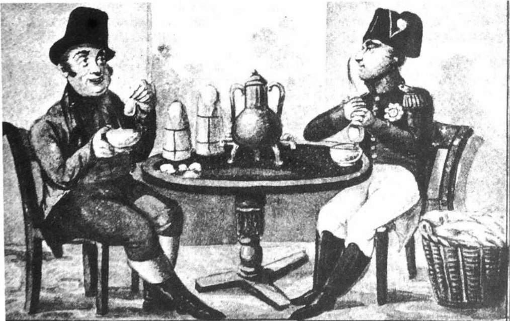
DE TWEE NIEUWE SÜYKER FABRIKUEERS.