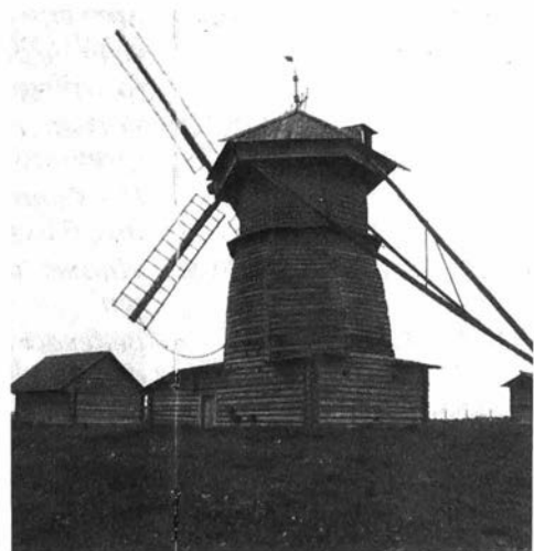
Heerlijke en leerrijke tochten. Zie blz. 234, voorlaatste paragraaf.