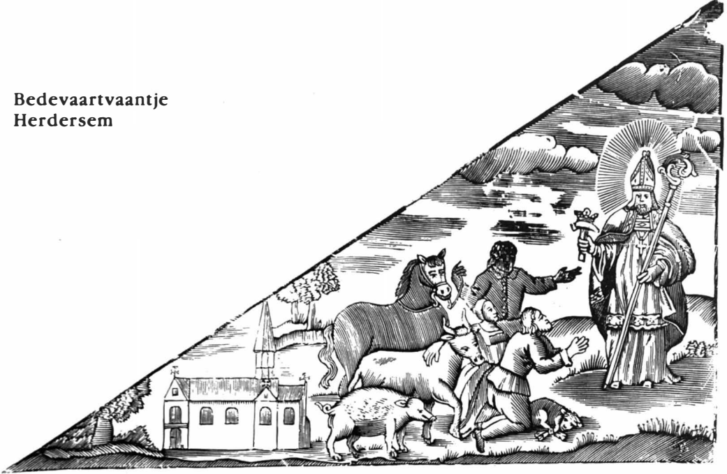
De Relikwien van St-Eloi worden geëerd in de parochiale kerk van Herdersem, bij Aalst.

Op het vaantje te Herdersem troont het tafereel opnieuw centraal; één element is erbij gevoegd : een zwijn. Ligt de eenvoudige verklaring erin, dat aldaar ook Sint-Antonius een bijzondere verering geniet?!