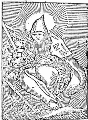
Bevrouwt op S. Antonius ten allen tyden, Hy menschen en Beesten zal bevryden.

Tot GEND, by PETRUS ANTONIUS KIMPE, Boekdrucker by de Capucynen.